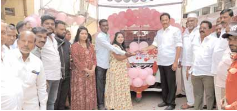
డైవర్ ఉద్యోగం నుండి సాంతకారు ఓనర్ గా అభివృద్ధి చెందుతున్నారని హర్షం