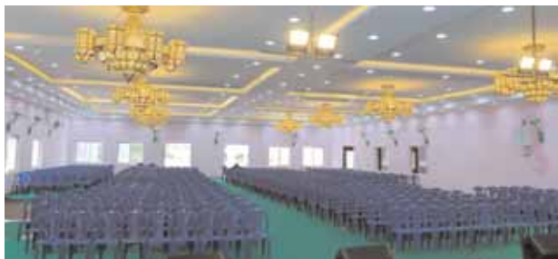
సీతాఫలమండి, మేజర్ న్యూస్: ఉపసభాపతి తీగుల్ల పద్మారావు గౌడ్ సికింద్రాబాద్ నియోజకవర్గ పేద, మధ్య తరగతులకు చెందిన ప్రజలకు సైతం