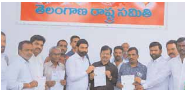
కార్యక్రమంలో ప్రజాప్రతినిధులు, ప్రజలు, పార్టీ శ్రేణులు తదితరులు పాల్గొన్నారు.