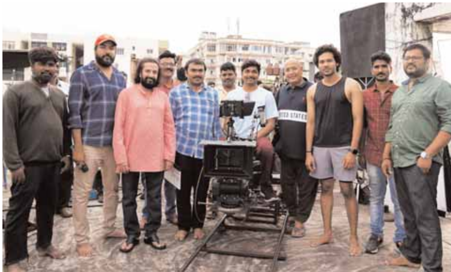
న్యూ మూవీ ఓపెనింగ్