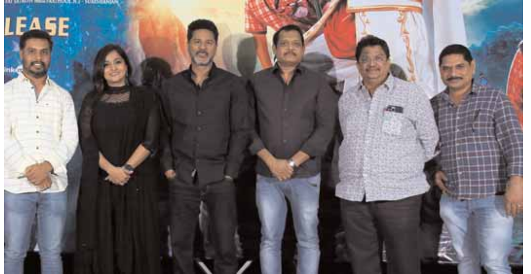
మై డియర్ భూతం