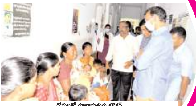
రోగులతో మాట్లాడుతున్న కలెక్టర్