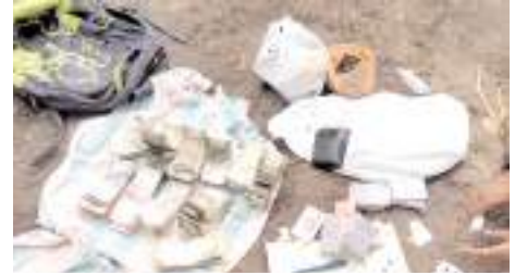
గతంలో దాడులలో పట్టుబడ్డ పేకముక్కలు, డబ్బు (ఫ్రెండ్ ఫోలో)

(మొదటిపేజీ తరువాయి) పేకాట ఆడుతున్న పేకాట పాపూరాలు ఆట ఆడకుండా తప్పించుకున్నారు. తాము వస్తున్న సమాచారం వారికి ముందే అందినట్లు విషయం తెలిసినా పోలీసులు తూతూ మంత్రంగా తనిఖీ చేసి తమ స్వామిభక్తిని చాటుకున్నారు. సోదాలో పేకాట ఆడుతున్న ఆనవాళ్లు మాత్రం కనపడినట్లు కొంతమంది పోలీసులు తెలిపారు. దాదాపు 40 మంది పోలీసు సిబ్బందితో వెళ్లిన డిఎస్సీని పాత్రికేయులు ఏమీ జరిగింది ఎక్కడ దాడులు చేశారని అడిగితే ఇది మామూలే మాకు అంటూ వెళ్లిపోయారు. అంతకుముందు పోలీసులు తమ వాహనాలతో చూడవచ్చి సృష్టించారు. ఆదోని, ఇతర ప్రాంతాల నుండి వచ్చిన పోలీసు జీపులు, ఆలూరు నియోజకవర్గంలోని సిఐ, ఎస్సీలు తమ వాహనాలతో సిబ్బందిని ఎక్కించుకొని హుటాహుటిన చిప్పగిరి వైపు వెళ్లిపోయారు. తీరా గుమ్మనూరు గ్రామానికి చేరుకొని సోదాలు నిర్వహించగా అనుమానితులు ఎవ్వరు కనపడకపోవడంతో నిరాశగా వెనుతిరిగి వచ్చారు. అయితే పాత్రికేయులకు వివరాలు చెప్పకుండా వెళ్లడం