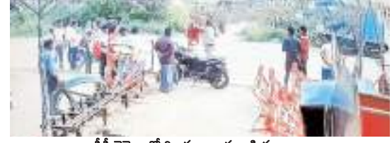
సీసీ కెమెరాలో రికార్డు అయిన దాడి దృశ్యాలు