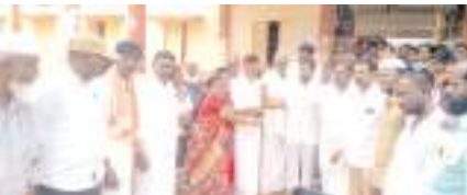
కస్తూరిభా పాఠశాలలో భూమిపూజ చేస్తున్న వైకాపా నాయకులు