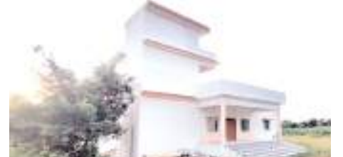
తహశీల్దార్ కొత్త కార్యాలయం

ఇంత వరకు ప్రారంభానికి నోచుకోక పోవడంతో ప్రజల్లో నిరాశ, నిష్ఠూహలు మొదలవుతున్నాయి. ఈ కార్యాలయం ప్రారంభానికి ప్రభుత్వ అధికారులకు కానీ, ప్రజా ప్రజానిధులకు పట్టడా అంటూ మండల ప్రజలు విమర్శిస్తున్నారు. కార్యాలయాలను అద్దె భవనాలలో కొనసాగించే వ్యవస్థకు చరమగీతం పాడరా అంటూ ప్రజలు విమర్శిస్తున్నారు. మండలంలో 16 గ్రామాలు ఉండగా, కేవలం మూడు గ్రామాలకు మాత్రమే ఉపయోగపడే విధంగా ఉన్న ప్రభుత్వ కార్యాలయాలను ప్రజలకు అందుబాటులోకి తెరా అంటూ ప్రజలు