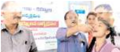
అచ్చెండ్రజోల్ మాత్రం విద్యార్థినికే వేస్తున్న డిఎంహెచ్వో

కర్నూలు, మేజర్ న్యూస్ : జాతీయ సులిపుగుల నిర్మూలన కార్యక్రమంలో భాగంగా బుధవారం