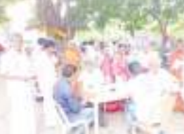
మండలను అందజేస్తున్న దృశ్యం

కొలిమిగుండ్ల మేజర్, న్యూస్ : కొలిమిగుండ్ల మండలం ఇటీవల గ్రామంలో రామ్ కో కార్పొరేట్ రెస్టారెంట్ లో భాగంగా బుధవారంనాడు కనకాద్రిపల్లెలో ఉచిత వైద్యశిబిరాన్ని నిర్వహించడం జరిగింది. ఈ ఉచిత వైద్యశిబిరానికి ప్రజలు అందరూ పాల్గొని విజయవంతం చేయడం జరిగింది. రోగులకు వైద్యపరీక్షలు నిర్వహించి మందులను అందజేయడం జరిగింది. 125 గ్రామాల ప్రజలు పాల్గొని కార్యక్రమాన్ని విజయవంతం చేయడం జరిగింది.