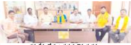
నమావేళలో మాట్లాడుతున్న గౌరు దంపతులు

కల్లూరు, మేజర్ న్యూస్ : ఎన్టీఆర్ హెల్త్ యూనివర్సిటీకి ఎన్టీఆర్ పేరు