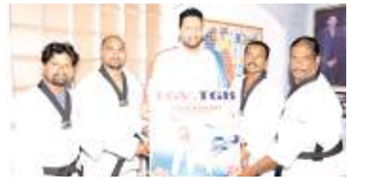
పోస్టర్ ఆవిష్కరణ వేదిక

కర్నూలు, మేజర్ న్యూస్ : జాతీయ సులిపుగుల నిర్మూలన కార్యక్రమంలో భాగంగా బుధవారం