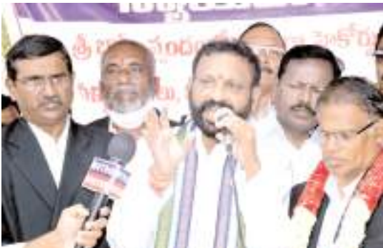
దీక్షకు మద్దతుగా మాట్లాడుతున్న మేయర్