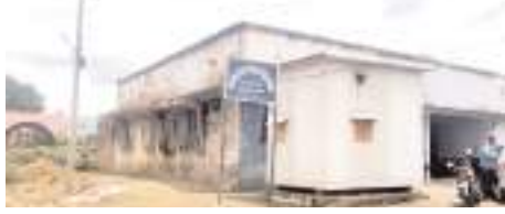
పాడుబడిన అద్దె భవనంలో కొనసాగుతున్న ఎంపీడీవో కార్యాలయం

మహానంది, మేజర్ న్యూస్ : రాజులు పోయే... రాజ్యాలు పోయే ప్రజల తలరాతలు మాత్రం మారలే అన్న చందంగా మహానంది మండల ప్రజల దుస్థితి తయారైందనడంలో అతిశయోక్తి లేదు. 1985లో మండల వ్యవస్థ ఏర్పడినా ఈ నాటికి కూడా మండల ప్రజల కష్టాలు తీరడం లేదు. మండల వ్యవస్థ మారలేదన దానికి మండలంలోని ప్రభుత్వ కార్యాలయాలే ప్రధాన సాక్ష్యాలు. ఆ నాటి నుంచి ఈనాటి వరకు మండల ప్రభుత్వ కార్యాలయాలు అద్దె భవనాల్లో ఇరుకు ఇరుకుగా కొనసాగుతున్నాయే తప్ప వ్యవస్థ మాత్రం మారడం లేదు. నిన్న కాక మొన్న వచ్చిన గ్రామ సచివాలయ వ్యవస్థలో మాత్రం అత్యంత సుందరంగా సచివాలయాల కార్యాలయాల్లో అధికారులు పాలన సాగిస్తున్నారు. తహశీల్దార్ కార్యాలయం తలరాత మారదేమోనన్న గునగునలు ప్రజల్లో వినిపిస్తున్నాయి. 1985లో ఏర్పడిన మండల వ్యవస్థలో తహశీల్దార్ కార్యాలయం