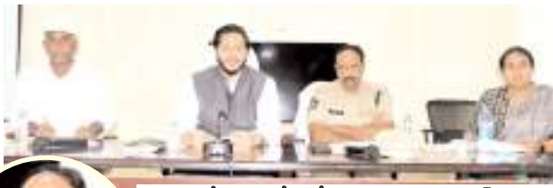
సమీక్షా సమావేశంలో మాట్లాడుతున్న జిల్లా కలెక్టర్

ఈ నెల 28న ముఖ్యమంత్రి వైఎస్ జగన్మోహన్ రెడ్డి ది రామ్ కో సిమెంట్ లిమిటెడ్ ప్రారంభోత్సవానికి రానున్న సందర్భంగా పర్యటన పనులు పకడ్బందీగా చేపట్టాలని జిల్లా