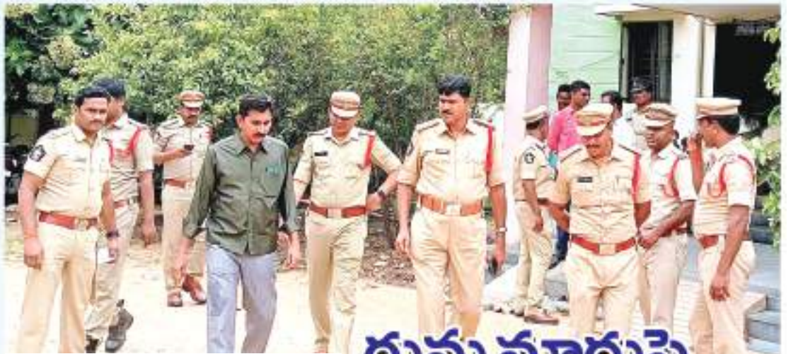
తనిఖీల అనంతరం స్టేషన్ ముందు పోలీసులు