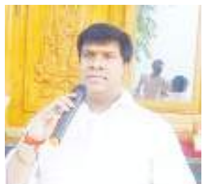
మాట్లాడుతున్న మాజీ ఎమ్మెల్యే బీవీ

రు. హెల్త్ యూనివర్సిటీని ఎన్టీఆర్ 1986లో స్థాపించారని 1998లో నారా చంద్రబాబునాయుడు ఎన్టీఆర్ హెల్త్ యూనివర్సిటీగా నామకరణం చేశారని ఇంతవరకు ముఖ్యమంత్రిగా పని చేసిన వారు ఎవరు యూనివర్సిటీ జోలికి పోలేదని కానీ సీఎం జగన్మోహన్ రెడ్డి ఎన్టీఆర్ పేరు తొలగించడం దుర్మార్గమని మండిపడ్డారు. వైసీపీ ప్రభుత్వం వచ్చి దాదాపు నాలుగు ఏళ్లు కావస్తున్నా కొత్తగా ఒక్క జిల్లాగా ప్రకటించి ఆయన పేరు మీదున్న హెల్త్ యూనివర్సిటీని పేరు తొలగించడం సరికాదన్నా