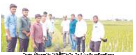
పంట పొలాలను పరిశీలిస్తున్న వ్యవసాయ అధికారులు