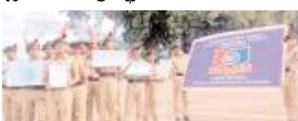
పంప్ హౌస్ వద్ద ఎన్సీసీ విద్యార్థులు