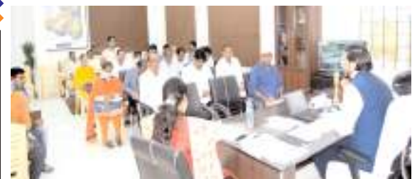
వీడియో కాన్ఫరెన్స్ లో పాల్గొన్న జిల్లా కలెక్టర్, జెసి