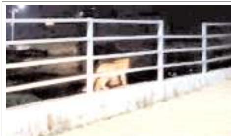
రహదారి పక్కన సంచరిస్తున్న చిరుత పులి

గడప గడపకు మన ప్రభుత్వం కార్యక్రమంలో వచ్చిన సమస్యలపై ప్రత్యేక దృష్టి సారించి ఆ మేరకు చర్యలు తీసుకోవాలని రాష్ట్ర ప్రభుత్వ ప్రధాన కార్యదర్శి సమీర్ శర్మ అన్ని జిల్లాల కలెక్టర్లకు సూచించారు. గురువారం వెలగపూడిలోని సచివాలయం నుంచి గడప గడపకు మన ప్రభుత్వం, ఇళ్ల నిర్మాణాలు, గ్రామసచివాలయాలు, రైతుభరోసా మిగతా 2లో