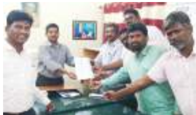
తహశీల్దార్ కు వినతి పత్రం ఇస్తున్న పీసీసీ నాయకులు

లేదని ఆయన వాపోయారు. పాఠశాల పక్కన గ్రామానికి అందుబాటులో నిత్యం ప్రజలు సంచరించే ప్రాంతంలోపాటు బస్టాండ్ ఆవరణం కావడం చేత స్థలాన్ని ఏర్పాటు చేయాలని కోరామన్నారు. స్థలం ఏర్పాటు విషయం గ్రామ స్థాయి నుండి జిల్లా కలెక్టర్ వరకు వినతులు ఇచ్చి స్థలం ఏర్పాటు చేయాలని కోరడం జరిగిందని తెలిపారు. జిల్లా పర్యటనకు వచ్చిన ఆంధ్రప్రదేశ్ ఎస్సీ, ఎస్టీ రాష్ట్ర కమిషనర్ ను కలిసి వినతి పత్రం అందింబగా ఆయన సానుకూలంగా స్పందించి జిల్లా కలెక్టర్ తోపాటు, ప్రజా చైతన్యపార్టీ కూడా సిఫారసు ఉత్పన్న అందించి ఏర్పాటు సహకరింబాలని సూచించారన్నారు. ఈవిషయంపై కల్లూరు తహశీల్దార్ స్థలాన్ని పరిశీలించడం జరిగిందని త్వరలో అధికారుల సలహా సూచనల మేరకు అంబే ద్కర్ విగ్రహాన్ని ఏర్పాటు చేస్తామని తెలిపారు. అయితే గ్రామంలో