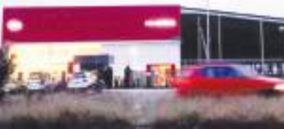
పెద్దటీకూరు సమీపంలో ఉన్న కియా షోరూం

- వాహనాలు అందక ఇబ్బందులు పడుతున్న ప్రజలు - నెలలు గడిచిన దెలివరి కాని కార్లు... ప్రదక్షణలు చేస్తున్న బుకింగ్ దారులు