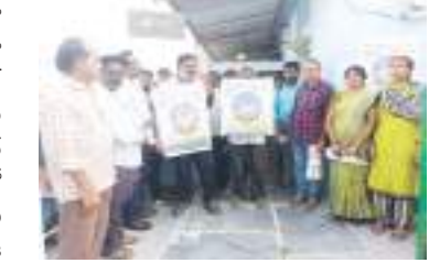
సుకన్య సంవృద్ధి యోజన గురించి ఇంటింటికి