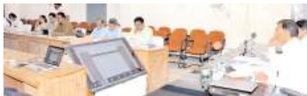
వీడియో కాన్ఫరెన్స్ లో కలెక్టర్, అధికారులు

సోదాలకు వస్తున్న అధికారులు కర్నూలు క్రైం, మేజర్ న్యూస్ : రాష్ట్ర వ్యాప్తంగా జరుగుతున్న ఎన్ టి పీ వి సోదాల్లో భాగంగా నగరానికి