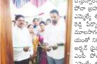
అర్బన్ హెల్త్ సెంటర్ను ప్రారంభిస్తున్న ఎంపి, ఎమ్మెల్యే నంద్యాల టౌన్, మేజర్ న్యూస్ : పేద ప్రజలకు మెరుగైన వైద్యం అందించడమే ముఖ్యమంత్రి జగన్మోహన్ రెడ్డి ధ్యేయంగా పని