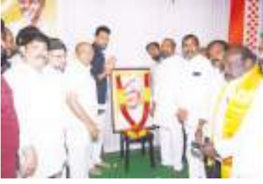
ఎన్టీఆర్ చిత్రపటానికి నివాళులు అర్పిస్తున్న తెదేపా నాయకులు కర్నూలు, మేజర్ న్యూస్ : రాష్ట్రంలో తెలుగుదేశం పార్టీ అధికారంలోకి రావాలంటే ప్రతి ఒక్కరూ క్షేత్రస్థాయిలో కష్టపడి పనిచేయాలని తెలుగుదేశం పార్టీ నేతలు పిలుపునిచ్చారు.

పార్టీ విజయానికి అందరూ కష్టపడాలి అర్థిఎన్ సమావేశంలో తెదేపా నేతలు