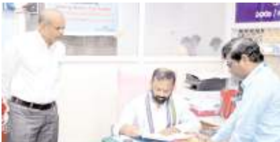
హాజరు పట్టిన పరిశీలిస్తున్న మేయర్