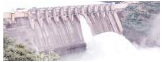
డ్యాం 1 గేటు నుంచి విడుదలవుతున్న నీరు

శ్రీశైలం, మేజర్ న్యూస్: ఎగువ పరివాహక ప్రాంతాల నుంచి శ్రీశైలం డ్యాంకు వరద నీటి ప్రవాహం తగ్గుముఖం పట్టింది. దీంతో జలాశయం 8 గేట్లలో ఏడు గేట్లను మూసివేసి కేవలం ఒక్క గేటు ద్వారా మాత్రమే నీటి విడుదలను కొనసాగిస్తున్నారు. గురువారం సాయంత్రం 6 గంటల సమయానికి జూరాల,తుంగభద్ర నదుల ద్వారా 1,38,522 క్యూసెక్కుల వరద నీరు వచ్చి చేరింది. జలాశయం బ్యాక్ వాటర్ ద్వారా పోతిరెడ్డిపాడు హెడ్ రెగ్యులేటర్ కు 8,000 వేల క్యూసెక్కులు, మల్యాల, హెచ్ ఎన్ ఎస్ఎస్ కు 1688 క్యూసెక్కులు, మహాత్మాగాంధీ కల్వకుర్తి ఎత్తిపోతల పథకానికి 1600 క్యూసెక్కుల నీటిని విడుదల చేశారు. డ్యాం ఒక్క గేటును పది అడుగుల మేర ఎత్తి 27,800 క్యూసెక్కులు, కుడిగట్టు విద్యుత్ కేంద్రం విద్యుత్ ఉత్పాదన