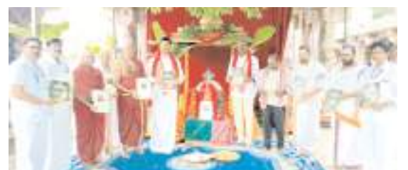
దసరా ఆహ్వాన పత్రికలను ఆవిష్కరిస్తున్న అధికారులు