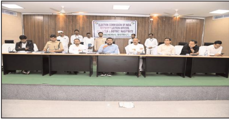
మంచుర్యాల ప్రతినిధి, నవంబర్ 26, సూర్య మేజర్ న్యూస్: