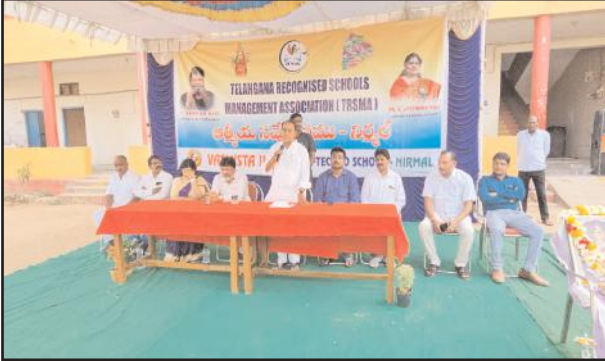
సోన్, సూర్య మేజర్ న్యూస్: