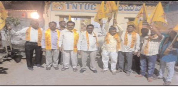
బెల్లంపల్లి నవంబర్ 18 సూర్య మేజర్ న్యూస్,