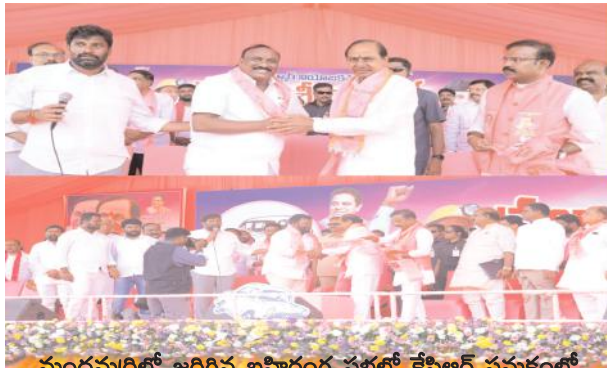
మందమర్రిలో జరిగిన బహిరంగ సభలో కేసీఆర్ సమక్షంలో చేరుతున్న దృశ్యం (ఫైల్ ఫోటో)

చెన్నూర్ నియోజకవర్గంలో ఎన్నిక సమరం ఆరంభమైనప్పటి నుండి కాంగ్రెస్ ఆశవాహుడిగా నియోజకవర్గంలో ప్రచారాన్ని కొనసాగించిన వ్యక్తే బిఆర్ఎస్ పార్టీలో చేరడంతో నియోజకవర్గంలోని ప్రజలు వస్థుయానికి గురయ్యారు. డాక్టర్ వృత్తికి రాజీనామా చేసి ప్రజల శ్రేయస్సు కోసం రాజకీయాల్లోకి వచ్చానని, బాల్య సుమన్ అరచకాల నుండి ప్రజలను విముక్తి చేయడానికి కంకణం కట్టుకున్నానని నియోజకవర్గంలో సుడిగాలి పర్కటనలు చేయడమే కాకుండా బాల్య సుమన్ ను ఇంటికి పంపే వరకు పోరాడుతానని ప్రచారం చేసిన వ్యక్తి అదే వ్యక్తి దగ్గర చేరడంతో ఇప్పటి వరకు తనతో తిరిగిన వారు అవాక్యవుతున్నారు. ఎన్నికేసులకైన వెనుకాడనని, గొంతు చించుకొని ప్రసంగాలు చేసిన వ్యక్తే అదే పార్టీలో చేరడంతో నియోజకవర్గం ప్రజలు వీరి మాటలను ఏమేరకు నమ్మి ఓట్లు వేస్తారో వేచి చూడాల్సిందే....!