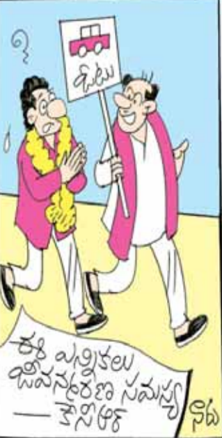
తెలంగాణకా, మన పార్టీకా సారే