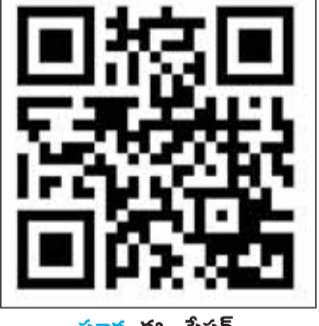
సూర్య ఈ - పేపర్

ఎదురులేని అటాత్ వస్తే ప్రపంచ కప్ టోర్నమెంట్ పైనల్ చేసిన టీమిండియా అసలు నినలు సమరంలో మాత్రం తడబడింది. మూడవ పర్యాయం ప్రపంచ కప్ గెలవాలన్న భారత్ ఆశలకు గండి పడింది. పైనల్ పోరులో ఆస్ట్రేలియా జట్టు ఇంకా ఏడు ఓవర్లు మిగిలి ఉండగానే ఆరు వికెట్ల తేడాతో భారత్‌ను ఓడించి ఆరవ సారి ప్రపంచ కప్‌ను గెలుచుకుంది. 241 పరుగుల లక్ష్యంతో తమ ఇన్నింగ్స్‌ను ప్రారంభించిన ఆస్ట్రేలియా ఏడు ఓవర్లలో 41 పరుగుల స్కోర్ లోపు మూడు వికెట్లు కోల్పోయింది. డేవిడ్ వార్నర్ 7, మిచెల్ మార్న్ 15, స్టీవ్ స్మిత్ 4 పరుగులకు అవుట్లయ్యారు. ఆ స్థితిలో ఓపెనర్ ట్రావిస్ హెడ్, ఐదవ నంబర్ బ్యాట్స్‌మన్ మార్నస్ లబుషేన్ తమ జట్టు ఇన్నింగ్స్‌ను పునర్నిర్మించారు.