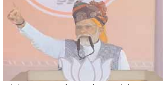
పార్టీ నేతలు దినుగత రాజేష్ పైలట్ తో కూడా అదే చేశారు. ఆయన కొడుకుతో కూడా అదే చేస్తున్నారు. రాజేష్ పైలట్ ప్రశ్నలపై కాంగ్రెస్ స్పందించడం లేదు.

ఆయన వైఖరి నష్టం పక్కన పెట్టి ఇప్పుడు కుమారుడిపై కోపం తీర్చుకుంటున్నారు. మీకు కాంగ్రెస్ చరిత్ర తెలుసు. ఢిల్లీ హైకోర్టులో కారణంగా పార్టీలోని తప్పాలకు వ్యతిరేకంగా స్వయం వెంటదానికీ వెళ్ళిన ప్రయత్నించినా రాజకీయంగా నష్టపోతారు. రాజేష్ పైలట్ ఒక్కసారి మాత్రమే కాంగ్రెస్ కు వ్యతిరేకంగా మాట్లాడారు. అది కూడా ఆ పార్టీ మంచి కోరికేనని. కానీ పార్టీ ఇప్పటి వరకు సచిన్ పైలట్ ను శిక్షిస్తోంది. తండ్రి మీద కోపంతో సచిన్ పైలట్ పట్ల ద్వేషపూరిత భావంతో ఉంది' అని ప్రధాని మోడీ విమర్శించారు. రాష్ట్రంలోని 200 అసెంబ్లీ స్థానాల్లో 30-35 స్థానాల్లో ఫలితాలను ప్రభావితం చేసే గుర్తర్ కమ్యూనిటీకి చెందిన పైలట్లను ఎన్నికల్లో లీక పాత్ర పోషిస్తున్నారు. రాజస్థాన్ శాసనసభకు శనివారం ఎన్నికలు జరగనున్నాయి.