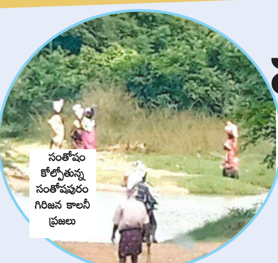
సంతోషం కోల్పోతున్న సంతోషపురం గిరిజన కాలనీ ప్రజలు

రామచంద్రాపురం మండలం, నెత్తకుప్పం గ్రామపంచాయతీలో రెవెన్యూ భూములపై భూ బక్తాసురుల కన్నుపడింది. దీనికి తోడువెలుగుశాఖలో పనిచేస్తూ ప్రజాపత్రినిధికి పిఎగా చెప్పకుంటున్న ఓన్లైన్ అన్నీతానే కబ్బదారులకు వ్యకేజీతో అండదండలు అందిస్తున్నట్లు విశ్వసనీయ సమాచారం. దీనికంతటికీ అధికార పార్టీకి చెందిన ఓ డివిజన్ అధ్యక్షుడు దర్శకత్వం వహించటం సర్వత చర్యేనీయాంసంగా మారింది. రోడ్డుకి ఒకవైపు రిజర్వ్ ఫారెస్ట్ ఉండగా మరోవైపు సైతం అటువంటి రకమైన చెట్లు పొదలతో నిండిన గుట్టలు ఉన్నాయి. ప్రత్యామ్నాయ వనీకరణకు అవి ఎంతో అనువుగా ఉంటూ వన్యప్రాణుల సంరక్షణకు అవసరపడతాయి. అయితే అధికారులు అండదండలతో కొంతమంది తమకు ఈస్థలం ఎక్స్ సర్వీస్ మెన్ కోటాలో కలెక్టర్ పట్టా ఇచ్చారు అని చెప్పుకుంటూ ఎక్కవేటర్లతో గుట్టలను గుల్ల చేస్తూ దాదాపు 25 హెక్టార్లకు పైగా పచ్చదనాన్ని నాశనం చేస్తున్నారు. వాటర్ షెడ్ నిధులతో మూగజీవాలు, వనస్త్రుగాల కోసం నిర్మించిన వూట కుంటాను కూడా ఆకవ్రించి పూడ్చివేయటం స్థనికుల ఆగ్రహానికి గురౌతూవుంది.