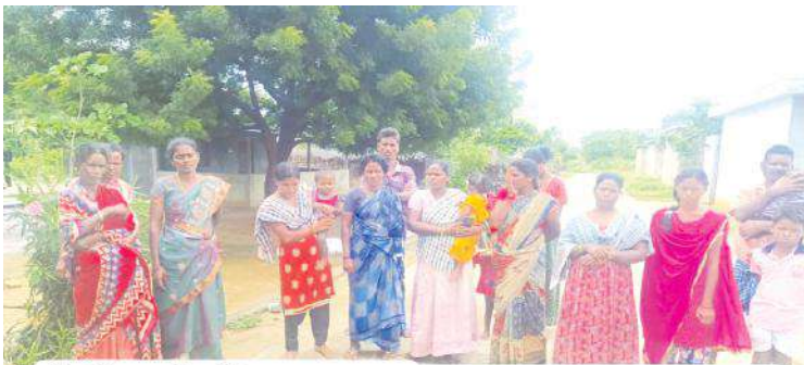
రేషన్ బండి కోసం నెలలుగా ఎదురు చూస్తున్న గిరిజనులు

మొదటి పేజీ తరువాయి చేసి తెచ్చుకోవాలి. అలాగే దరఖాస్తు గిరిజన కాలనీ రోడ్డుకు అటువైపు మరో పంచాయతీకి చెందిన దరఖాస్తు హరిజనవాడకు వస్తున్న వాహనం, మా గ్రామానికి ఎందుకు రావడం లేదు, ఎన్నిసార్లు అడిగిన ఇదో వస్తుంది, అదో వస్తుంది అని చెప్పున్నారు తప్ప మా బాధను అర్థం చేసుకునే నాభుడే కరువయ్యాడని ఆవేదన చెందారు. ఈ విషయంపై స్థానిక తహసీల్దార్ గౌరీ శంకరావు దృష్టికి తీసుకెళ్లగా, దీనిపై కంపైంట్ చేసి ఉన్నారని, దీలరు వెళ్ళమని చెబుతున్నప్పటికీ, వాహన సిబ్బంది నిర్లక్ష్యం చేస్తున్నారని, సమాచారం జిల్లా ఉన్నతాధికారులకు తెలియజేసి ఉన్నామని, త్వరలో చర్యలు చేపడతామని, డిసెంబర్ నెలలో రేషన్ వాహనం ద్వారా అందించేలా చర్యలు తీసుకుంటామని తెలిపారు. మండలంలో మరొకాన్ని చోట్ల కూడా రేషన్ బియ్యం, రెండు, మూడు కిలోమీటర్లు తల మీద మోసుకెళ్ళే పరిస్థితులు ఉంది. సంబంధిత అధికారులు మండలం నందు రేషన్ వాహనం సేవలను సక్రమంగా అమలు జరిగేలా చర్యలు తీసుకోవాల్సిన అవసరం ఎంతైనా ఉంది.