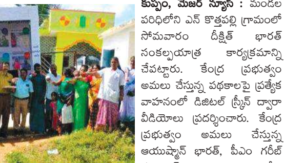
దయ్యాల అంత్యోదయ యోజన, పీఎం ఆవాస్ యోజన తదితర సంక్షేమ పథకాలను ప్రజలకు తెలియజేసే విధంగా డిజిటల్ స్ట్రీట్ ద్వారా ప్రచారాన్ని చేపట్టారు.