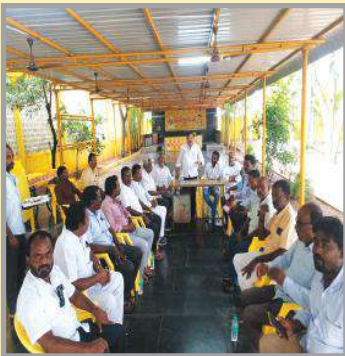
చిత్తూరు సిటీ, మేజర్ న్యూస్:

- పార్లమెంట్ ఎస్సీ సెల్ అధ్యక్షులు పీఠర్