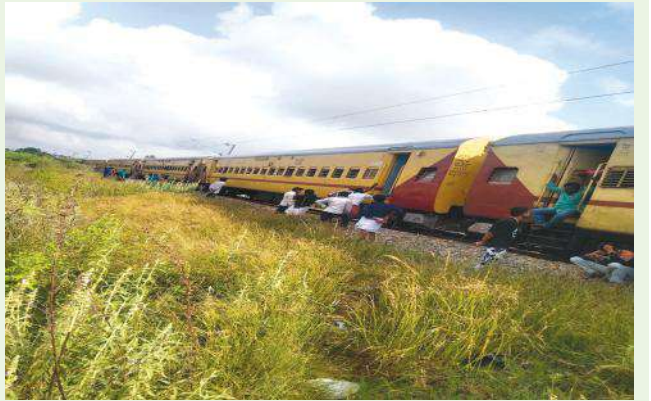
పూతలపట్టులోని పి.కొత్తకోటలో సంఘటన స్థలానికి చేరుకుని రైల్వే పట్టాలను మరమ్మతులు చేసిన తర్వాత రైలు బయలు దేరాటం చేత ప్రయాణికులు ఊపిరి పీల్చుకున్నారు.

ఐరాల, మేజర్ న్యూస్: కేంద్ర ప్రభుత్వ రైల్వే శాఖ అధికారుల పర్యవేక్షణ కరువై నందున రైల్వే పట్టాలు పగుళ్లు రావడం స్థానిక రైల్వే సిబ్బంది గమనించడం వలన రామేశ్వరం నుంచి చిత్తూరు మీదుగా తిరుపతి కి వెళ్తున్న 16780 నెంబరు గల రామేశ్వరం ఎక్స్ ప్రెస్ రైలు ఆగిన సంఘటన చిత్తూరు జిల్లా పూతలపట్టు మండలం పి.కొత్తకోట సమీపంలో సోమవారం ఉదయం జరిగింది. దీంతో రైలు కు పెను ప్రమాదం తప్పడం తో ప్రయాణికులు ఊపిరి పీల్చుకున్నారు. ప్రయాణికులు కథనం మేరకు సంఘటనకు సంబంధించిన వివరాలు ఇలా ఉన్నాయి. రామేశ్వరం నుంచి రామేశ్వరం ఎక్స్ ప్రెస్ రైలు సోమవారం ఉదయం చిత్తూరు, పూతలపట్టు, పాకాల, పనుపాకం, చంద్రగిరి మీదుగా తిరుపతికి వెళ్తు తున్న సందర్భంలో పూతలపట్టు పట్టు మండలం పరిధిలోని పి.కొత్తకోట సమీపంలో రైల్వే పట్టాలు పగుళ్లు తీసిన సంఘటనను స్థానిక రైల్వే సిబ్బంది గమనించి రైలును ఆపివేయడం జరిగింది. అనంతరం ఈ సమాచారాన్ని సంచారం తెలుసు కున్న పాకాల రైల్వే శాఖ సిబ్బంది