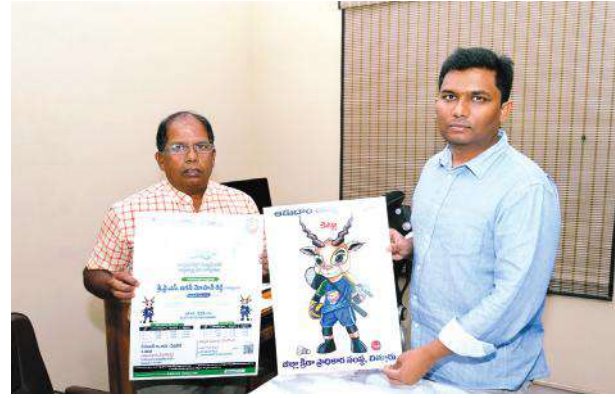
చిత్తూరు కలెక్టరేట్, మేజర్ న్యూస్: