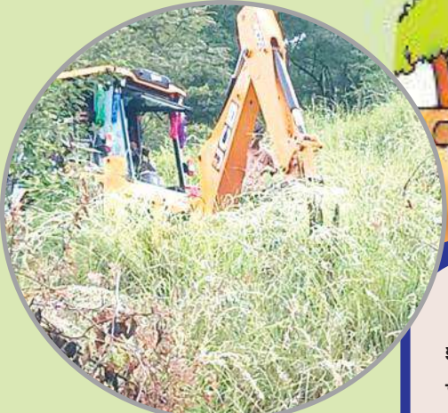
తిరుపతి ప్రతినీధి, మేజర్ న్యూస్:

రిజర్వ్ ఫారెస్ట్ కాన్పుటికి అడవిచెట్లతో నిండిన భూమి కాబట్టి దాని వినియోగంలో తగిన విచక్షణను పాటించాలని సుప్రీంకోర్టు. జాతీయహరిత ట్రిబ్యునల్ మార్గదర్శకాలు ఉన్నప్పటికీ స్థానిక రెవెన్యూ అధికారి అండదండలతో పట్టాలు తెచ్చుకున్నాం