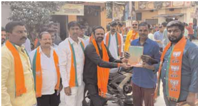
కర్కర ఫూట్, మేజర్ న్యూస్: శనివారం ఉదయం ఎల్సీనగర్ నియోజకవర్గం చంపాపేట్ డివిజన్ పరిధిలో చంపాపేట్ ఓల్డ్ విలేజ్, కటిక బస్టి, కుమ్మరి బస్టి,