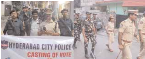
సిటీబ్యూరో,మేజర్న్యూస్:అసెంబ్లీ ఎన్నికలు సమీపిస్తున్న నేపథ్యంలో గురువారం వారాసిగూడ,చార్మినార్,చాదర్ఘాట్,సైఫాబాద్,మంగళహాట్ పోలీస్ స్టేషన్ల పరిధిలో సంబంధిత పోలీసు ఉన్నతాధికారులు, ఏ.సి.పి.లు, సి.ఐ.లు, ఎస్.ఐ.లు,అదనపు పోలీసు బలగాలతో ప్రత్యేకంగా ఫ్లాగ్ మార్చ్ నిర్వహించారు.