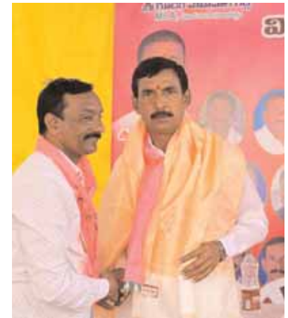
రెడ్డి, కాలనీవాసులు, కార్యకర్తలు, తదితరులు పాల్గొన్నారు.