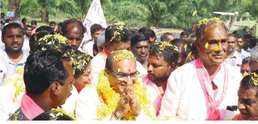
- సంక్షేమ పథకాల విజయానికి నాంది.