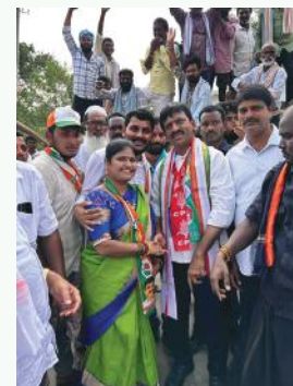
కూసుమంచి సూర్య మేజర్