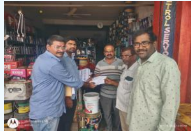
నేలకొండపల్లి సూర్య మేజర్ స్యూస్

ఈ నెల 30 న జరగనున్న ఎన్నికల పోలింగ్ కు సంబంధించిన పోల్ స్లిప్పులను శరవేగంగా జరుగుతున్నాయి. ఆదివారం