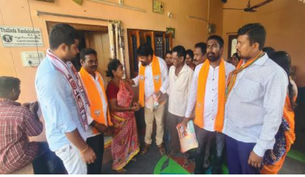
పెనుబల్లి సూర్య మేజర్ న్యూస్...

భారతీయ జనతా పార్టీ పెనుపల్లి మండలంలో ఎన్నికల ప్రచారం నిర్వహించారు. భారతీయ జనతా పార్టీ పెనుబల్లి మండల శాఖ ఆధ్వర్యంలో ఆదివారం జనసేన పార్టీ బలపరిచిన భారతీయ జనతా