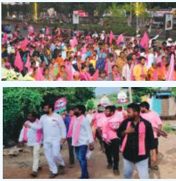
రఘునాథపాలెం-సూర్య మేజర్ స్యూస్....