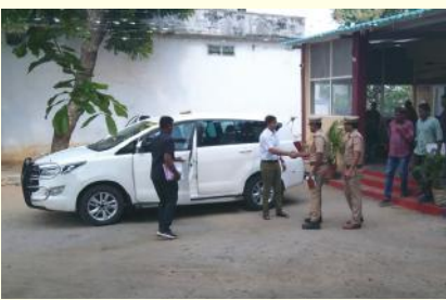
నేలకొండపల్లి సూర్య మేజర్ న్యూస్