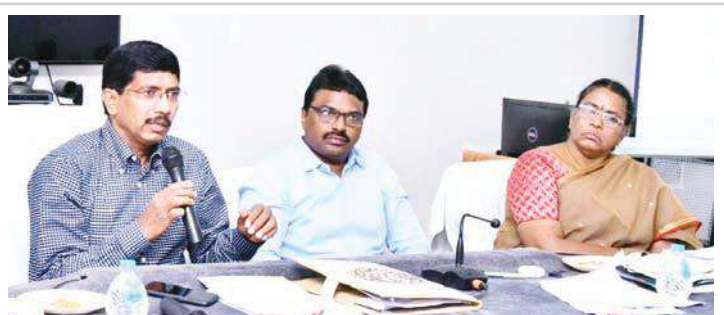
జిల్లాలో వికసిత భారత్ సంకల్పయాత్ర కార్యక్రమాన్ని