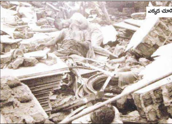
ఎక్కడ చూసిన శవాల గుట్టలే..