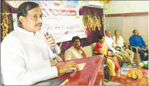
సమాజాన్ని చదివే తీరిక ఎవరికీ వుండటం లేదు