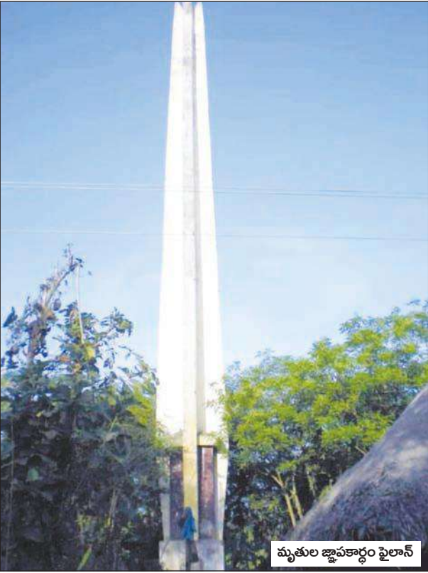
మృతుల జ్ఞాపకార్థం ఫైలాన్

అవనిగడ్డ మేజర్ స్కూల్ : దివిసీమను ఉప్పెన రూపంలో కబళించి నేటికి 46 సంవత్సరాలు కవస్తున్నా దివిసీమలో కనీస అవసరాలైన తాగునీరు, రహదారులను పూర్తి స్థాయిలో గత ప్రభుత్వాలు అభివృద్ధి చేయలేకపోయాయి. అవనిగడ్డ నుండి కోడూరు మీదగా హంసలదీవి, పాలకాయతిప్ప రహదారి అవనిగడ్డ నుండి నాగాయలంక మీదగా పరిసర లంక గ్రామాలకు వెళ్ళడానికి రహదారులు అధ్వానంగా ఉన్నాయి. నాగాయలంక, కోడూరు మండలాలలో జనవరి నుండి జూన్ నెల వరకు తాగునీటికి నేటికి ఇబ్బందులు ఎదుర్కొంటున్నారు. తీర ప్రాంతాల్లో తుఫాను పెల్లర్లను అభివృద్ధి చేసిన దాఖలాలు కూడా కనిపించడం లేదు. పాలకులు మారినా, ప్రభుత్వాలు మారినా ఎక్కడ వేసిన గోంగళి అక్కడే అన్న చందంగా దివిసీమ అభివృద్ధి మిగిలిపోయింది. నాగాయలంక మండలం ఎదురుమొండి వద్ద వాయుగుండం తీరాన్ని దాటగా గంటకు 130 నుండి 160 కి. మీ. వేగంతో వీచిన గాలులకు సముద్ర అలలు 8 మీ. ఎత్తున ఎగిసిన రాకాశి అలల సముద్రతీర ప్రాంతాన్ని ముంచి మొత్తం తుడిచి పెట్టుకుపోయింది. దివిసీమతో పాటు గుంటూరు జిల్లా నిజాంపట్నం, రేవల్లెలో ప్రళయం సృష్టించి 14 వేల మందికి పైగా పొట్టన పెట్టుకోగా ఒక్క దివిసీమలోనే 9 వేల మంది మృత్యువాత పడ్డారు. కోడూరు మండలం పాలకాయ తిప్పలో 460, మూలపాలెంలో 300, నాగాయలంక మండలం సోర్లగొందిలో 714 మంది భవనాలలో తలదాచుకున్నవారు. నాగాయలంక మండలంలోని సోర్లగొంది, నాచుగుంట, సంగమేశ్వరం, ఎదురు మొండి, ఈలచెట్టిదిబ్బ, ఏటిమోగ, కమ్మనమోల, దీనదయాశ్రవరం, గుల్ల