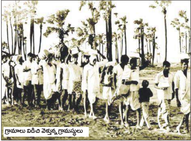
గ్రామాలు విడిచి వెళ్తున్న గ్రామస్థులు

అది తలచుకొంటే ఇప్పటికీ దివిసీమ ప్రజల గుండె జలదరిస్తుంది. ఆ ఉప్పెనలో 14 వేల మంది పైగా మృత్యువాత పడగా దివిసీమలోనే 9 వేల మంది మరణించారు. రూ. 172 కోట్ల ఆస్తి సముద్రంపాలైంది. 1977 నవంబర్ నెలలో బంగాళాఖాతంలో వాయుగుండం ఏర్పడి క్రమేపి బలపడి నవంబర్ 19 న పెను ఉప్పెనగా బీభత్సం సృష్టించింది.