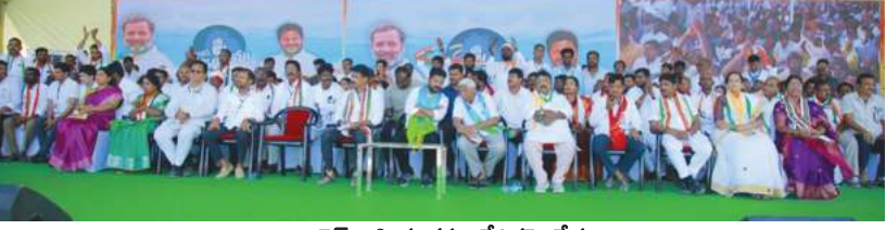
కాంగ్రెస్ బహిరంగ సభావేదికపై నేతలు