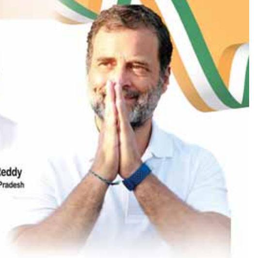
Shri Rahul Gandhi