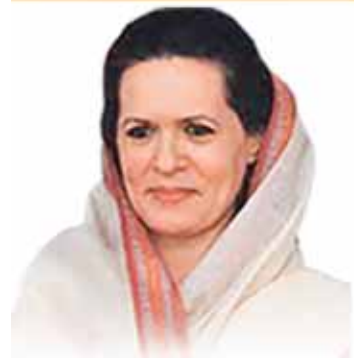
Smt. Sonia Gandhi Indian National Congress