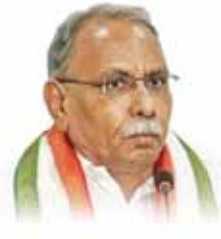
Shri K.V.P. Ramachandra Rao Indian National Congress