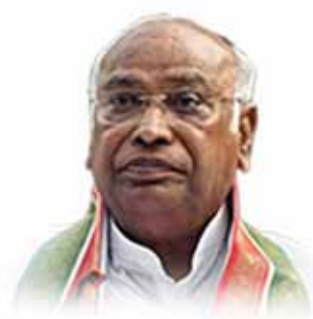
Shri Mallikarjun Kharge President, Indian National Congress