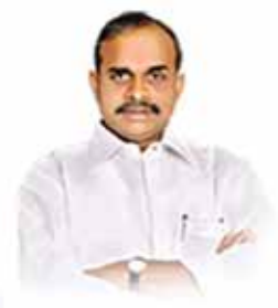
Shri Dr. Y S Rajashekhar Reddy Former Chief Minister of Andhra Pradesh