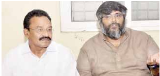
మాపై రాజకీయంగా ఎంత బురద చల్లినా ప్రజలకు మెమెంటో తెలుసు...