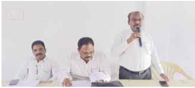
సంబంధిత పాఠశాల అభివృద్ధి మరియు ఆవాస ప్రాంత ప్రణాళికలలో సమావేశం చేయవలసిన తెలియజేశారు. ఈనెల 23వ తేదీ లోపు గ్రామసభలు నిర్వహించి పాఠశాల అభివృద్ధి మరియు ఆవాస ప్రాంత ప్రణాళికలను పూరించి మండల విద్యాశాఖ అధికారి వారి కార్యాలయమునకు అందజేయాలన్నారు.

ఉదయగిరి మేజర్ స్కూల్ పాఠశాల అభివృద్ధి ఆవాస ప్రాంత ప్రణాళికలపై ప్రధానోపాధ్యాయులతో ప్రత్యేక సమావేశం ఏర్పాటు చేశారు ఉదయగిరి మండల విద్యాశాఖ అధికారి 1 శ్రీ షేక్ మస్తాన్ వలీ మరియు మండల విద్యాశాఖ అధికారి 2 శ్రీ తోట శ్రీనివాసులు ల ఆధ్వర్యంలో శనివారంస్థానిక స్త్రీ శక్తి భవన్ నందు ఉదయగిరి మండలంలోని అన్ని పాఠశాలల మరియు ప్రభుత్వ జూనియర్ కాలేజీ ల ప్రధానోపాధ్యాయులకు పాఠశాల అభివృద్ధి ప్రణాళిక మరియు ఆవాస ప్రాంత ప్రణాళికల పై సమావేశం నిర్వహించడం జరిగినది. ఈ సమావేశం నందు మండల విద్యాశాఖ అధికారులు మాట్లాడుతూ ప్రతి పాఠశాల పరిధిలోని గ్రామంలో ప్రధానోపాధ్యాయులు గ్రామసభలు నిర్వహించి ఆ పాఠశాల అభివృద్ధికి కావలసిన వనరులు నిధులను గ్రామసభలో చర్చించి పాఠశాల అభివృద్ధి మరియు ఆవాస ప్రాంత ప్రణాళికలలో చేయవలసిన సూచించారు. 2024-25 మరియు 2025-26విద్యా సంవత్సరంలోకి సంబంధించి పాఠశాలల అభివృద్ధికి ఏ ఏ వనరులు అవసరమవుతాయి మరియు ఎంత నిధులు కావాలో