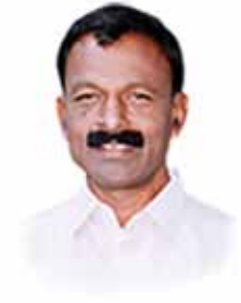
Shri N. Raghuvveera Reddy APCC, Ex-President, Andhra Pradesh