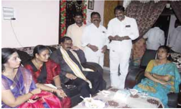
నియోజకవర్గం అభివృద్ధికి రూ. 50 కోట్లు నిధులు మంజూరు ఎంపీ ఆదాల