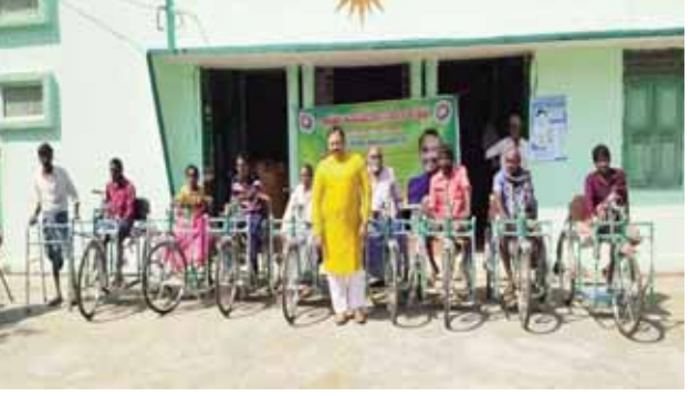
- నిరుపేదలకు చదువు