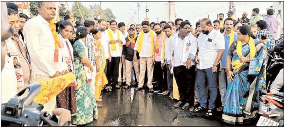
కొండలను, ఇసుక క్వారీలను మొత్తం దోచేశాడని విమర్శించారు. ప్రజలకు అవసరమైన రోడ్లు కనిపించలేదని అని ప్రశ్నించారు.

బాలినేని చేసిన అభివృద్ధి ఏంటో ప్రజలకు చెప్పాలి: దామచర్ల అనంతరం మీడియాతో దామచర్ల మాట్లాడుతూ రోడ్డుపై ప్రయోగమంటేనే ప్రజలు వణికిపోతున్నారని అన్నారు. రాష్ట్రంలో రహదారులపై ఉన్న గోతులు చెరువులను తలపిస్తున్నా ఈ ప్రభుత్వానికి ఏమీ పట్టడం లేదన్నారు. వైసీపీ ప్రభుత్వం కనీసం రహదారులను కూడా నిర్మించలేని దిక్కుమాలిన పరిస్థితిలో ఉందన్నారు. గత టిడిపి ప్రభుత్వంలో రికార్డు స్థాయిలో 25 నేల కి.మీ. సిమెంటు రోడ్లు వేసినట్టు తెలిపారు. టిడిపి, జనసేన కలిసి వచ్చే ఎన్నికల్లో సైకో జగన్ ను గద్దెదింపుతామన్నారు. దామచర్ల, దోచుకోవడం తప్ప ఎమ్మెల్యే నియోజకవర్గానికి చేసిన అభివృద్ధి ఏమీ లేదన్నారు. ఒంగోలు నియోజకవర్గంలో ఉన్న