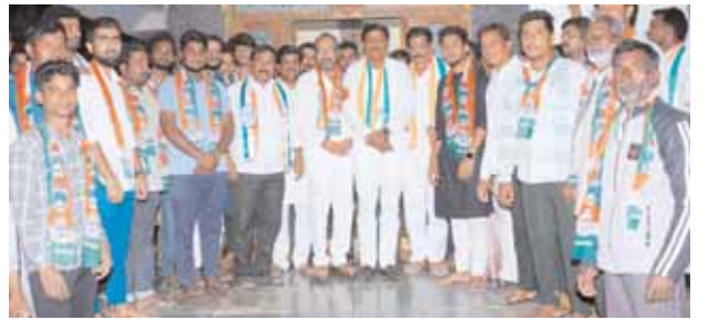
కాంగ్రెస్ లో చేరుతున్న బీఆర్ఎస్ నాయకులు, కార్యకర్తలు.