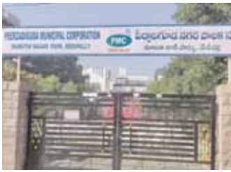
పీర్లాదిగూడ పురపాలక సంస్థ కార్యాలయం

మేడిపల్లి మేజర్ న్యూస్ (నవంబర్ 18) ఎన్నికలలో నిష్పక్షపాతంగా