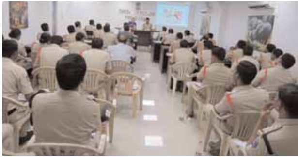
సమావేశంలో పాల్గొన్న పోలీస్ అధికారులు.

★పోలీస్ అధికారులకు డిఐజి, పోలీస్ అజ్జార్వర్ తాగుర్ తాప