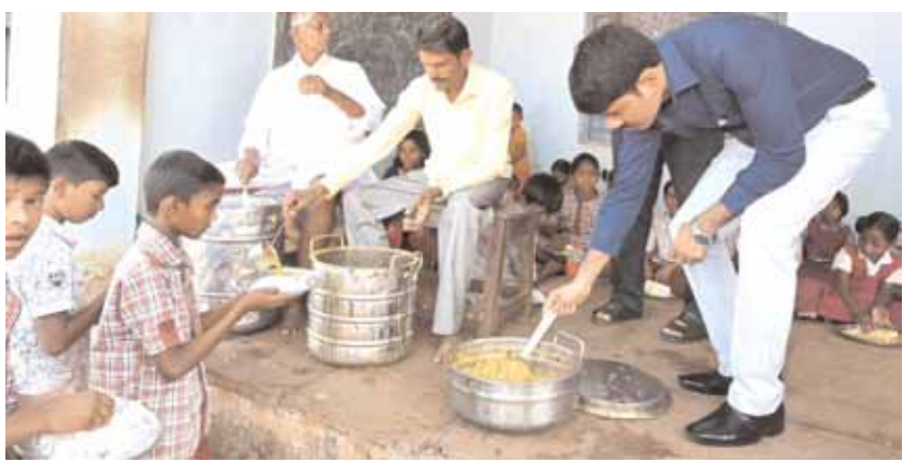
ధన్వారం పాఠశాలలో మధ్యాహ్న భోజనాన్ని పరిశీలిస్తున్న కలెక్టర్ నారాయణ రెడ్డి.

జిల్లా ఎన్నికల అధికారి, కలెక్టర్ నారాయణ రెడ్డి