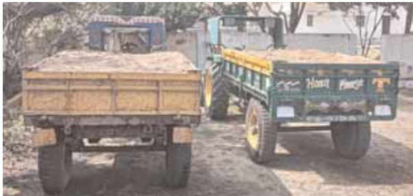
పోలీసులు స్వాధీనం చేసుకున్న ఇసుక ట్రాక్టర్