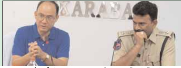
సమావేశంలో మాట్లాడుతున్న డిఐజి,పోలీస్ అబ్జర్వర్ తాగూర్ తాప

పోలీస్ అధికారులకు డిఐజి,పోలీస్ అబ్జర్వర్ తాగూర్ తాప