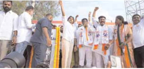
రోడ్ షోలో మాట్లాడుతున్న పవన్

తాండూరు మేజర్ న్యూస్ (నవంబర్ 25) : తెలంగాణ రాష్ట్రానికి బీసీ ముద్దు బిడ్డా ముఖ్యమంత్రి కావాలి అని జన సేన పార్టీ అధ్యక్షుడు, ప్రముఖ సినీ హీరో పవన్ కళ్యాణ్ పేర్కొన్నారు. అత్యధిక శాతం బీసీ ఓట్లు కలిగి ఉండగా ఓట్లు మావీ సీట్లు మీకా అని ఆయన అన్నారు. ఎన్నికల ప్రచారంలో భాగంగా శనివారం నాడు వికారాబాద్ జిల్లా తాండూరు పట్టణంలోని ఇందిరా చౌక్ లో జరిగిన ప్రచార సభలో ఆయన గర్జించి హోరెత్తించారు. బీసీ లకు డబ్బులు తయారై లు ముఖ్యం కాదు అని రాజ్యాధికారం కావాలని ఆయన అన్నారు. కొద్ది శాతం ఓట్లు ఉన్న వారు పదవులు అనుభవించగా ఇతరులు ఎట్టి చాకిరికి సరి పోతున్నారని అన్నారు అవినీతి అక్రమాలకు కళ్ళెం వేయడానికి, సమాజంలో మార్పులు తేవడానికి జన సేన పార్టీ పోరాడుతుంది అని ఆయన అన్నారు. తమ పార్టీ లో నిప్పులు చెరిగే యువత ఉన్నదని ఆయన అన్నారు. ఉమ్మడి రాష్ట్రంలో జలయజ్ఞం పేరుతో వైఎస్ దోచుకున్నారని పవన్ కళ్యాణ్ గుర్తు చేశారు. సమాజంలో మార్పులు తేవడానికి గద్దర్ ఎంతగానో పోరాటం చేశారు అని ఆయన అశాసు