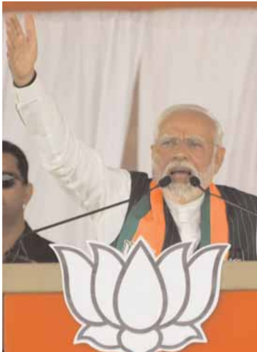
విజయ సంకల్ప సభలో మాట్లాడుతున్న ప్రధాని మోడీ