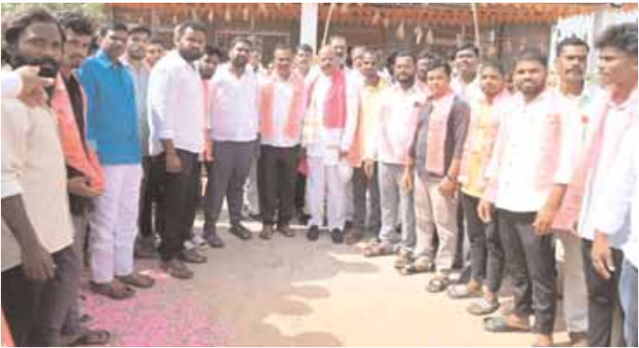
ఇబ్రహీంపట్నం (యాచారం), మేజర్ న్యూస్ రం జోరుగా సాగుతోంది. గ్రామాల్లో ప్రజల నుంచి విశేష స్పందన లభిస్తుంది. ప్రచారంలో భాగంగా ఆదివారం పోల్కొనవల్లి, విండ్ల