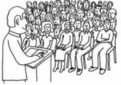
CHURCH MEETINGS ARE BRILLIANT

జన సమీకరణంతో ప్రత్యర్థులకు దడ పుట్టించాలని తాము గెలుస్తామన్న విషయాన్ని వారికి కల్పించాలని వివిధ పార్టీల ఎమ్మెల్యే అభ్యర్థులు మరి మరి పోటీ పడి విప్లవవిడిగా ఖర్చు చేస్తున్నట్లు తెలుస్తుంది. అయితే అన్ని పార్టీల ప్రచారాలకు వచ్చిన వారే రావడంపై రాజకీయ పండితులు, మేధావులు చర్చించుకుంటున్నారు. అభ్యర్థులు చేపట్టిన అభివృద్ధి కార్యక్రమాలు తమ పార్టీ, పార్టీల అభ్యర్థులు చేపట్టిన మేనిఫెస్టోతో పాటు భవిష్యత్తులో నియోజకవర్గంలో అభివృద్ధి చేయాలనుకుంటున్న అభివృద్ధి కార్యక్రమాలను గురించి ప్రజలకు వివరిస్తే సరిపోయే దానికి ఇలా పెద్ద ఎత్తున జన సమీకరణ చేసి ర్యాలీల ద్వారా ప్రచారం నిర్వహించడం వల్ల అభాసుపాలు కావడం తప్ప ఒరిగేదేమీ లేదని ప్రజలు, ఓటర్లు చర్చించుకుంటున్నారు.