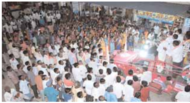
ప్రచారంలో పాల్గొన్న నాయకులు, కార్యకర్తలు.