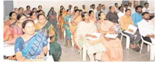
శిక్షణ తరగతులకు హాజరైన పిఓ,ఎపిఓలు.

మొదటిపేజీ తరువాయి... ఈ సందర్భంగా కలెక్టర్ మాట్లాడుతూ.. పోలింగ్ ను ప్రశాంత వాతావరణంలో సమర్థ వంతంగా నిర్వహించాలన్నారు. ఎన్నికల కమిషన్ నియమావళిని అనుసరించి విధులు నిర్వహించాలని కలెక్టర్ తెలిపారు. ఎన్నికల కమిషన్ ఇచ్చిన హ్యాండ్ బుక్ లెట్స్ ను క్షుణ్ణంగా చదివి పోలింగ్ విధానాన్ని ఎలాంటి తప్పులు జరగకుండా చేపట్టాలని కలెక్టర్ తెలిపారు. ఎన్నికల విధి నిర్వహణలో పనిచేసే అధికారులు ఎలాంటి ఒత్తిడికి లోను కాకుండా ప్రశాంతంగా అధికారులందరూ సమన్వయంతో పని చేస్తూ పోలింగ్ ప్రక్రియను చేపట్టాలన్నారు. అధికారులు బాధ్యతాయుతంగా వ్యవహరించి పోలింగ్ సజావుగా జరిగేలా సహకరించాలని కలెక్టర్ కోరారు. రీపోలింగ్ కు అన్యాయం లేకుండా కంగారు పడకుండా జాగ్రత్తగా విధులను చేపట్టాలని ఆయన సూచించారు. మాక్ పోలింగ్ ను నిర్వహించిన తదనంతరం అన్ని క్లియర్ చేసి పోలింగ్ ను చేపట్టాలని కలెక్టర్ సూచించారు. ముందుగా జెడ్పీహెచ్ఎస్ లో జరుగుతున్న బ్యాలిట్ ఓటింగ్ ప్రక్రియను కలెక్టర్ క్షుణ్ణంగా పరిశీలించారు. ఈ