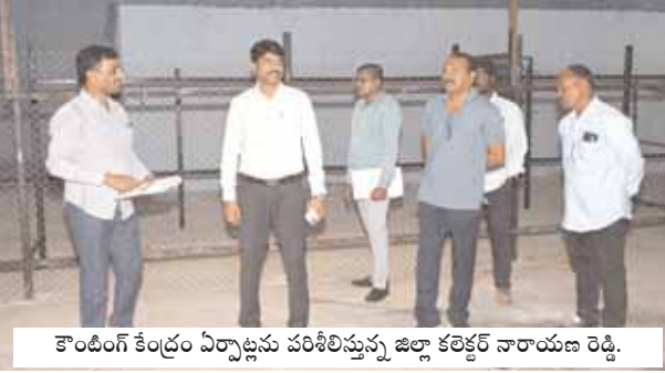
కాంటింగ్ కేంద్రం ఏర్పాటును పరిశీలిస్తున్న జిల్లా కలెక్టర్ నారాయణ రెడ్డి.

జిల్లా ఎన్నికల అధికారి, కలెక్టర్ సి.నారాయణరెడ్డి