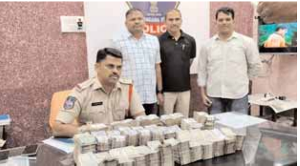
డబ్బులు స్వాధీనం చేసుకున్న దృశ్యం