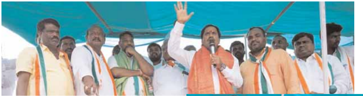
తలకొండపల్లి, మేజర్ న్యూస్ (నవంబర్ 21) : ఇందిరమ్మ రాజ్యంలోనే ఉచిత కంటిని ఇచ్చిందని, బడుగు బలహీన వర్గాలకు ఇందిరమ్మ ఇంట్లు ఇచ్చి, పేదల