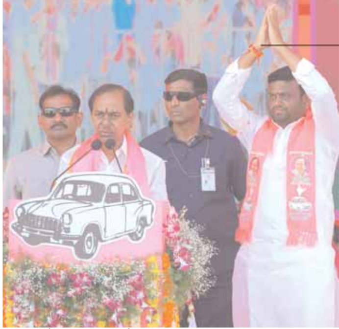
ఆశీర్వాదా సభలో మాట్లాడుతున్న సీఎం కేసీఆర్.