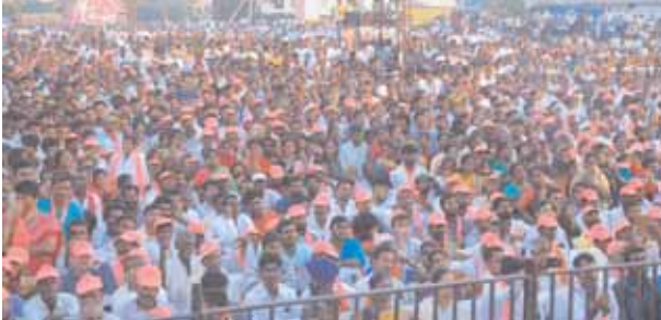
సభకు హాజరైన జనం