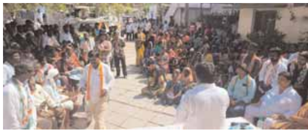
పాల్గొన్న నాయకులు, కార్యకర్తలు.