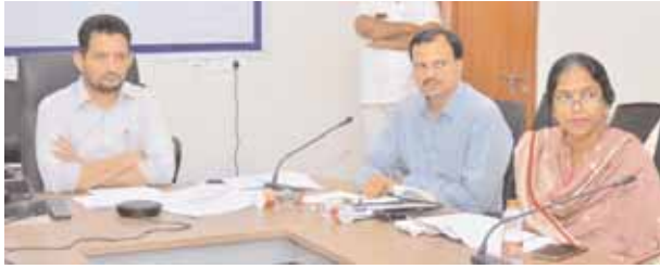
వీడియో కాన్ఫరెన్స్లో మాట్లాడుతున్న కలెక్టర్ గౌతం