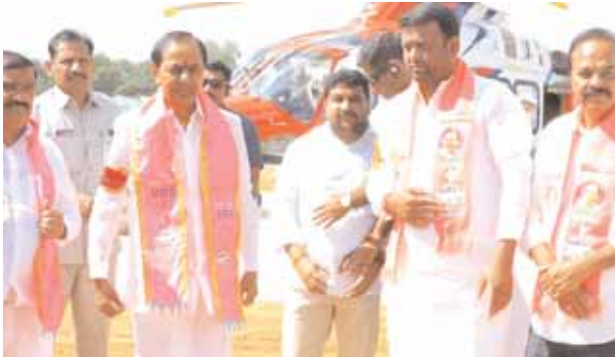
హెలికాప్టర్ దిగుతున్న సీఎం కేసీఆర్.

● ఎక్కడ చూసినా గులాబీ జెండాలు, కటౌట్లు దర్శనమిచ్చాయి ● జోరుహోరుగా సాగిన సీఎం సభ