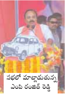
సభలో మాట్లాడుతున్న ఎంపీ రంజిత్ రెడ్డి

ప్రజా ఆశీర్వాద సభలో చేపెళ్ల ఎంపీ గడ్డం రంజిత్ రెడ్డి