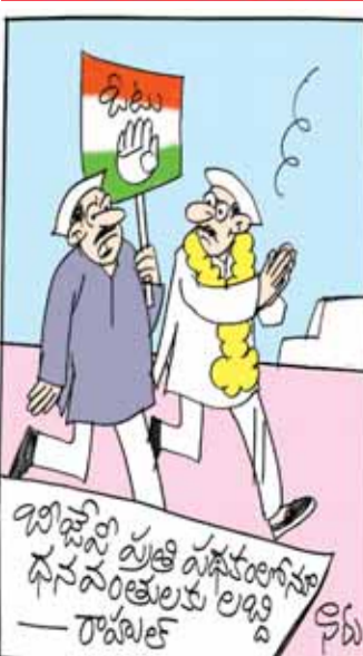
ఎన్నికల్లో మనం ఖర్చు పెట్టేది డబ్బులున్నావే సామ్యులే కదా