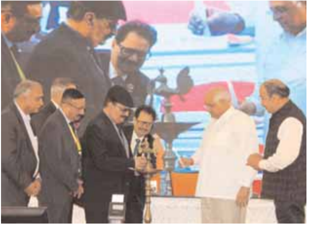
అహ్మదాబాద్ కాన్ఫెరెన్స్ సెక్యూరిటీ లీడర్ షిప్ సమితి 2023ను గుజరాత్ ముఖ్యమంత్రి భూపేంద్రభట్ల పటిల్