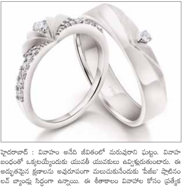
షైదరాబాద్ : వివాహం అనేది జీవితంలో మరుపురాని ఘట్టం. వివాహ బంధంలో ఒక్కొక్కరినూ యువతీ యువకులు ఉమ్మడిచేసుకుంటారు. ఈ అద్భుతమైన క్షణాలను అభ్యుదయం మలుచుకునేందుకు 'సీజీఐ' ఫ్లాటినం లవ్ బ్యాండ్స్ నిర్దేశం ఉన్నాయి. ఈ శీతాకాలం వివాహం కోసం ప్రత్యేక

క్షయాలను అనుకుంటున్నాము. ఒక ఆలోచనాపూర్వక లైఫ్ లైఫ్ మోసాదా పద్ధతులను ముందుగానే కనుగొనడమే మరియు నివారించడానికి సంస్థలో ప్రమాద-చేతన సంస్కృతిని నడిపించడంతో సహా సూతర రిస్క్ మేనేజ్మెంట్ పద్ధతులను ప్రవేశపెట్టింది. ఎడెల్వైస్ టోకయో లైఫ్ ఇన్సూరెన్స్ 99.20% క్లెయిమ్ సెటిల్మెంట్ నిష్పత్తిని, 13వ నెల 75% నిలకడ నిష్పత్తిని మరియు ఒక 54 ఎన్పిఎస్ (వినియోగదారు సంతృప్తి) యొక్క ఒక చర్య) ను రిపోర్ట్ చేశారు. సంస్థ ఈ రంగములో సూతర ఉత్పత్తులను కూడా పెంచింది మరియు ఎడెల్వైస్ టోకయో లైఫ్ వెల్డ్ అల్టిమా, ఎడెల్వైస్