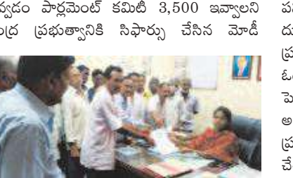
ప్రభుత్వం పెన్షన్ పంచడానికి చతులు రాబట్టడం విమర్శించారు. రైల్వే రాయితాలు ఇవ్వడం లేదని ఆగ్రహం వ్యక్తం చేశారు. 75 లక్షల మంది పెన్షన్ దార్లకు మోడీ ప్రభుత్వం అన్యాయం చేస్తుందని

సంవత్సరాలు తన సర్వీస్ కాలంలో కంపెనీల పని చేస్తూ భారతదేశ పారిశ్రామిక అభివృద్ధికి పాటుపడ్డారని తెలిపారు అలాంటి కార్యాలకులకు రిటైర్ అయిన తర్వాత కనీసం వెయ్యి రూపాయలు ఇవ్వడం పార్లమెంట్ కమిటీ 3,500 ఇవ్వాలని కేంద్ర ప్రభుత్వానికి సిఫార్సు చేసిన మోడీ