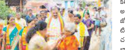
20 లక్షలు ఉద్యోగాలు ప్రతి గ్రామములో ఇంటింటికి డ్రింకింగ్ వాటర్ సదుపాయము కల్పిస్తామని అన్నారు దీపం పథకం కింద మూడు ఉచిత గ్యాస్ లు సరఫరా చేస్తామని అన్నారు తల్లి

చంద్రబాబు నాయుడు మళ్ళీ అధికారంలోకి రావడం ఖాయమని అన్నారు ప్రజలు టిడిపి పార్టీకి ప్రతి గ్రామంలో ఆదరణ ఉందని అన్నారు ప్రజలు నిరాశనాలు పడుతున్నారని అన్నారు టిడిపి అధికారంలో ఉంటే వచ్చేనా వెంటనే సంక్షేమ పథకాలు యువ గలము పేరుతో నిరుద్యోగులకు