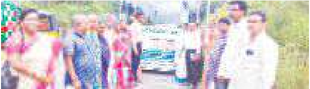
ఉచితంగా ఆపరేషన్స్ చేస్తారని తెలిపారు. ఇంకా 20 మంది రెఫరల్స్ వెళ్ళవలసి ఉందని తెలిపారు. జగన్ నన్ను సురక్షలో కంటి చూపు దూరం, దగ్గర చూపు లోపం ఉన్న వారికి కొత్తవలస పీఠాన్ని కి 650 మంది కళ్లదూలు కి ఎంపిక అయినట్లు, విద్యుంపేట పీఠానికి సి కి 400 మంది కళ్లదూలు కి ఎంపిక అయినట్లు తెలిపారు. ఈ నెల 24వ తేదీ వరకు కళ్లదూలు అందజేస్తామని తెలిపారు.