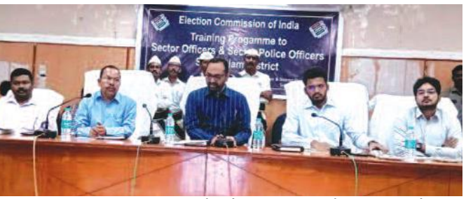
కేంద్రాల పరిధి ఉంటుందని చెప్పారు. సెక్టార్ అధికారులకు ఎన్నికల సమయంలో మెజిస్ట్రేటులు అధికారాలు ఇస్తామని, సెక్టార్ అధికారులు తమ పరిధిలోని ప్రతి పోలింగ్ కేంద్రాన్ని స్వయంగా సందర్శించి వసతులను, ఓటర్లకు అనుకూలతలను పరిశీలించాలని, సమస్యాత్మక అంశాలను సమాధానం చేసుకోవాలన్నారు. అలాగే తమ పరిధిలో సోపర్, కమ్యూనిటీ, పోలిటికల్, లా అండ్ ఆర్డర్ పరిస్థితులు ఎలా ఉన్నాయో పర్యవేక్షించాలని సూచించారు. బాల్ లెవల్ అధికారులు, తహసీల్దార్లు, ఎంపీ డివీలు, ఎస్సీ డివీలును ఒకరికి ఒకరు పరిచయం చేసుకోవాలని, గ్రామల్లో మిగతా 2లో

క్రీడాకళ, నవంబర్ 25, మేజర్స్ న్యూస్: ఎన్నికల నిర్వహణలో సెక్టార్ అధికారులదే కీలక పాత్ర అని జిల్లా కలెక్టర్, జిల్లా ఎన్నికల అధికారి శ్రీకేమ్ లారకర్ అన్నారు. ప్రజాస్వామ్యంలో ఎన్నికలు ఎంతో ముఖ్యమైనవి చెప్పారు. జిల్లా పరిషత్ సమావేశ మందిరంలో శనివారం ఏర్పాటు చేసిన సెక్టార్ అధికారులు, సెక్టార్ పోలీసు అధికారుల మొదటి విడత శిక్షణ కార్యక్రమంలో ఆయన మాట్లాడారు. ఎన్నికలకు నాలుగు నెలల ముందుగా సెక్టార్ అధికారులను నియమించి వారికి శిక్షణ ఇవ్వాలని ఎన్నికల సంఘ మార్గదర్శకాలు ఉన్నాయన్నారు. రిటర్నింగ్ అధికారులకు ఈ సెక్టార్ అధికారులు అనుసంధానమై ఉంటారని, ఒకొక్క రిటర్నింగ్ అధికారి కింద 20 నుంచి 30 సెక్టార్లు ఉంటాయని, ఒక సెక్టార్ అధికారికి 10 నుంచి 15 పోలింగ్