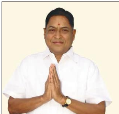
లాస్ట్ ఛాన్స్..! ఇదేవివరి ఎన్నికలు అంటూ రెడ్యానాయక్ ప్రచారం రెడ్యానాయక్ రాజకీయ ప్రస్థానం

ఉమ్మడి మరిపెడ మండలం లోని ఉగ్రం పల్లి గ్రామంలో 1981లో సర్పంచ్ గా ఏకగ్రీవ ఎన్నికై రాజకీయ ప్రస్థానం చేశారు. అదే సంవత్సరం మరిపెడ మండల సమితి అధ్యక్షుడిగా రెడ్యానాయక్ గెలిచారు. 1987 లో మండల ప్రజా పరిషత్ అధ్యక్షుడిగా ఎన్నికయ్యారు. 1989 లో తొలిసారిగా డోర్నల్ అసెంబ్లీ జనరల్ సీట్ నుంచి కాంగ్రెస్ తరపున పోటీ చేసి ఎమ్మెల్యేగా ఎన్నికయ్యారు తర్వాత వరుసగా కాంగ్రెస్ నుంచి 1994, 1999, 2004,