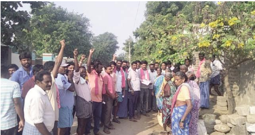
నల్లికుదురు నవంబర్ 17 మేజర్ న్యూస్(సూర్య) చూసినవిధంగా ఉన్న లేదా అనేది ప్రజలు ఒకసారి మానుకోవటంలో జరిగిన అభివృద్ధి గతంలో ఆలోచన చేసుకోవాలని గ్రామ శాఖ అధ్యక్షులు