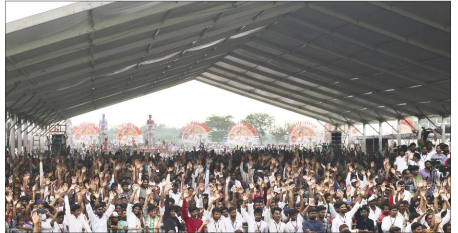
మహబూబాబాద్ ప్రతినీధి, నవంబర్ 24, మేజర్ న్యూస్ (సూర్య):

తెలంగాణ రాష్ట్రాన్ని 10 సంవత్సరాలు పాలించి బిఆర్ఎస్ ప్రభుత్వం అన్ని వర్గాలను మోసం చేసిన బిఆర్ఎస్ ప్రభుత్వానికి గడువు ముగిసిందని ఏబిసీసీ ప్రధాన కార్యదర్శి ప్రియాంక గాంధీ విమర్శించారు. శుక్రవారం పాలకుర్తి నియోజకవర్గం లోని తొర్రూరు డివిజన్ కేంద్రంలోని కాంగ్రెస్ పార్టీ ఆధ్వర్యంలో నిర్వహించిన పాలకుర్తి విజయభేరి సభకు ముఖ్య అతిథిగా పాల్గొన్న ఏబిసీసీ ప్రధాన కార్యదర్శి, నయా ఇందిరా గాంధీ ప్రియాంక గాంధీ మాట్లాడుతూ కేంద్రంలో ప్రధాని నరేంద్ర మోడీ, రాష్ట్రంలో సీఎం కేసీఆర్ లు ప్రజాధనాన్ని దోచుకుంటున్నారని అన్నారు. బిఆర్ఎస్ బిజెపి రెండు కుమ్మక్క అయ్యారని విమర్శించారు. బిజెపి బిఆర్ఎస్ ప్రభుత్వాల పేదల కోసం చేసింది ఏమీ లేదని, 10 ఏళ్లుగా అధికారంలో ఉన్న కేంద్ర రాష్ట్ర ప్రభుత్వాల అపరాధాలతో విర్రవీగుతున్నాయని ఆరోపించారు. రాష్ట్రంలో రోజురోజుకూ మహిళలపై అత్యాచారాలు