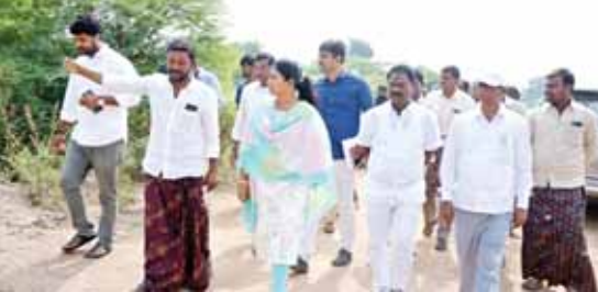
అధికారులు, వైఎస్సార్సీపీ నాయకులు, తదితరులు పాల్గొన్నారు.

ఆదేశించారు. ఎమ్మెల్యే మాట్లాడుతూ.. రైతులకు సాగు, త్రాగు నీటి కొరత లేకుండా చేసేందుకు ముఖ్యమంత్రి వైఎస్ జగన్మోహన్ రెడ్డి అన్ని విధాలుగా కృషి చేస్తున్నారన్నారు. హెచ్.ఎల్.సి కెనాల్ నుంచి కుంటలకు నీటిని అందించడం ద్వారా నీటి కొరత లేకుండా రైతులు, ప్రజలు సంతోషంగా ఉంటారన్నారు. ఈ కుంటలకు నీటిని అందించటం ద్వారా చుట్టుపక్కల గ్రామాలు జంగంరెడ్డి పేట, ఎల్లుట్ల, మడుగు పల్లి, మూగె తిమ్మంపల్లి గ్రామాల రైతులకు త్రాగు నీటి కొరత తీరనుంది. ఈ కార్యక్రమంలో ప్రజాప్రతినిధులు, సంబంధిత