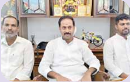
గళం విన్పించారని, యువనేత నారా లోకేష్ నేడు భావి తరాలకు భవిష్యత్తు నాయకుడిగా పరిపక్వత సాధించారని కొనియాడారు. ఇప్పటికే ప్రజలంతా