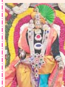
గ్రామం వివిధ ప్రాంతాలలో స్వాములు తిమ్మాపురం నుండి ఇరుముడి కట్టుకొని పాదయాత్రగా హనుమాన్ సర్వోత్ నుండి ఉత్సవమూర్తులను కొలవదీర్చిన శోభయాత్రలో పాల్గొన్నారు. గుంతకల్లు పురవీధులో హనుమాన్ హనుమాన్ అంటూ నామంతో శోభయాత్రలో చెక్కభజనలు నృత్యాలు భజంత్రీలు శోభయాత్ర కమనీయంగా రమణీయంగా నెట్టికంటిని శోభయాత్ర ముందుకు సాగుతూ స్వామి వారిని దర్శించుకొని గ్రామ ప్రజలు మొక్కులు తీర్చుకున్నారు. అనంతరం అంజనేయ స్వామి దేవస్థానం ఏర్పాటు చేసిన హోమంలో స్వాములు పాల్గొని భజనలు చేస్తూ స్వామి వారి ఇరుముడి సమర్పించుకొని ఉదయం స్వామి వారి తీర్థప్రసాదాలు

గుంతకల్లు రూరల్, మేజర్ న్యూస్ : గుంతకల్లు మండల పరిధిలోని వెలసిన సుప్రసిద్ధ పుణ్యక్షేత్రం కనాపురం శ్రీ నెట్టికంటి అంజనేయ స్వామి దేవస్థానం నందు శనివారం ఏకాదశి ఇరుముడి సమర్పణ సందర్భంగా స్వామివారిని అభిషేకాలు నిర్వహించి పూలమాలలతో ప్రత్యేకంగా స్వామివారిని సర్వసందర్భంగా అలంకరించి స్వామివారి దర్శనార్థం వచ్చిన భక్తులకు దర్శన భాగ్యం కల్పించారు. అనంతరం ఏకాదశి సందర్భంగా స్వామివారి దర్శనార్థం వచ్చిన భక్తులకు ఉత్తరం ద్వారం నుండి లోపలికి వెళ్లే విధంగా ఏర్పాటు చేశారు, దీక్షలు చేపట్టిన స్వాములు ఇరుముడి సమర్పించడానికి నలమూలల నుండి వేలాదిమంది భక్తులు నెట్టికంటి అంజనేయస్వామి దేవస్థానం చేరుకున్నారు. కనాపురం