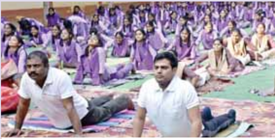
విద్యార్థులతో కలిసి యోగా నిర్వహిస్తున్న జాయింట్ కలెక్టర్