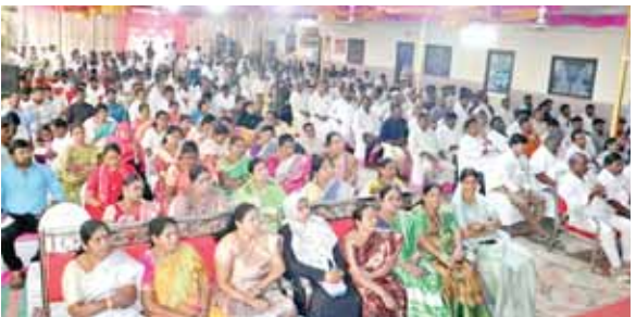
విశ్వసించే పరిస్థితి లేదన్నారు.