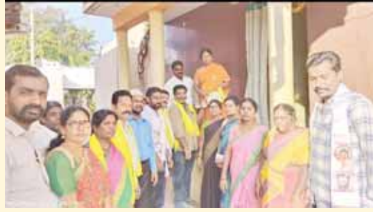
ఎదురు గ్రామంలో పర్యటిస్తున్న హిమబిందు