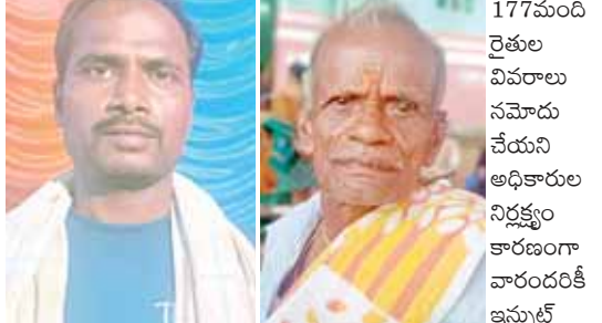
177మంది రైతుల వివరాలు నమోదు చేయని అధికారుల నిర్లక్ష్యం కారణంగా వారందరికీ ఇన్సుల్ట్

హాజరైన జిల్లా స్థాయి అధికారులు వ్యవసాయ అధికారుల నిర్లక్ష్యంతో 177మంది రైతులకు ఇన్సుల్ట్ సబ్సిడీ కట్