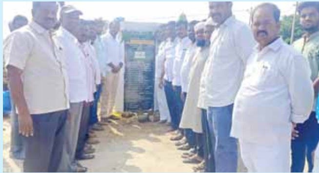
మన్ననలను పొందామన్నారు. వీటన్నిటిని చూసి ఓర్వలేని చంద్రబాబు నాయుడు, వారి దుష్ట చతుష్టవం జగన్మోహన్ పై బురదజల్లే కార్యక్రమాలు చేస్తున్నారని, వీటిని ప్రజలు తిప్పి కొట్టాలని సూచించారు. ఈ కార్యక్రమంలో ప్రజాప్రతినిధులు, వైసిపి నాయకులు, అధికారులు పాల్గొన్నారు.