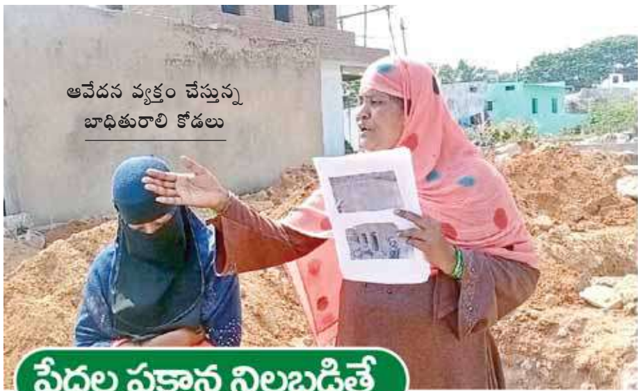
ఆవేదన వ్యక్తం చేస్తున్న బాధితురాలి కోడలు