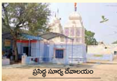
ప్రసిద్ధ సూర్య దేవాలయం