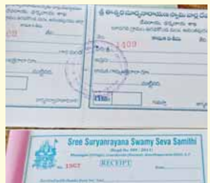
ఇరువురు పోటీ పోటీగా భక్తుల నుంచి సేకరించే విరాళాల పుస్తకాలు