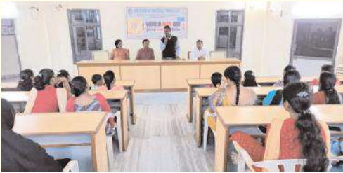
ఎయిడ్స్ వ్యాధిపై అవగాహన కల్పిస్తున్న వైద్యులు