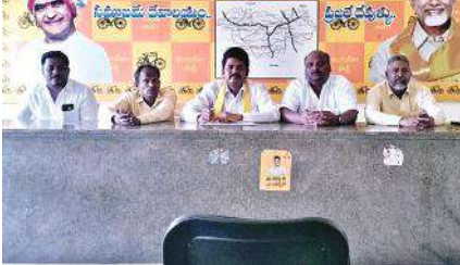
చిత్తూరు టీడీపీ కార్యాలయంలో విలేకరుల సమావేశంలో మాట్లాడుతున్న టీడీపీ నాయకులు

చిత్తూరు సిటీ, మేజర్ న్యూస్: తప్పులు లేని ఓటర్ల జాబితా ముద్రణకు అధికారులు చిత్తశుద్ధితో పనిచేయాలని చిత్తూరు టీడీపీ నాయకులు పేర్కొన్నారు. ఈ సందర్భంగా చిత్తూరు టీడీపీ కార్యాలయంలో ఏర్పాటు చేసిన సమావేశంలో వారు మాట్లాడుతూ భారత ఎన్నికల కమిషన్ అధికారులు ఎన్నికల ప్రక్రియలో భాగంగా తప్పులు లేని ఓటర్ల జాబితా మరియు ఓటుకు అర్హత కలిగిన ప్రతి పౌరునికి ఓటు హక్కు కల్పించే బాధ్యతను ఎన్నికల విధులు నిర్వహిస్తున్న ప్రతి ఒక్క ప్రభుత్వ అధికారి పాటించాలని ఆదేశాలు జారీ చేస్తే ఈ ఆంధ్రప్రదేశ్ లో ఈ ముఖ్యమంత్రి జగన్మోహన్ రెడ్డి పరిపాలనలో చాలామంది ఎన్నికల విధులు నిర్వహిస్తున్న ప్రభుత్వ అధికారులు నిబంధనలకు త్రిలోదకాలు ఇచ్చి అధికార వైసీపీ పార్టీకి తొత్తులుగా మారి అర్హత కలిగిన ఓటర్లను జాబితా నుండి తొలగించడం, అర్హత లేని వారికి ఓటు హక్కును కల్పించడం, వేల సంఖ్యలో బినామీ ఓటర్లను జాబితాలో చేర్పించడం, చెల్లకు ఓట్లు, బీరువాలకు ఓట్లు, తలుపులకు ఓట్లు, జీరో నెంబర్లు తో పదుల సంఖ్యలో ఓట్లు నమోదు చేయడం, ఒకే కుటుంబంలోని ఓట్లు పక్క బాతుల్లోకి, పక్క వార్డులోకి మార్చి నమోదు చేయడం, చనిపోయిన ఓట్లను జాబితాలో అలాగే ఉంచి ముసాయిదా జాబితాను ముద్రించడం, గ్రామాలలో లేని వారికి ఉన్నట్లుగా ఓటు హక్కును కల్పించడం, ఉన్న వారి ఓటును