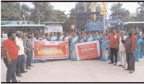
పుత్తూరు తాసిల్దార్ కార్యాలయం వద్ద నిరవధిక దీక్షను చేపడుతున్న అంగన్వాడీ వర్కర్లు

పుత్తూరు, మేజర్ న్యూస్: రాష్ట్ర ప్రభుత్వం అంగన్వాడీ వర్కర్ల డిమాండ్లను వారి సమస్యలను పరిష్కరించాలని నిరవధిక దీక్షను చేపట్టారు. మంగళవారం సిబిటియూ ఆధ్వర్యంలో పుత్తూరు పట్టణంలోని తాసిల్దార్ కార్యాలయం వద్ద నిరవధిక దీక్షను చేశారు. ఈ సందర్భంగా వారు మాట్లాడుతూ అంగన్వాడీ వర్కర్ల సమస్యలను పరిష్కరించడంతోపాటు తమ డిమాండ్లను ప్రభుత్వం వెంటనే పరిష్కరించాలని వారు కోరారు. లేనిపక్షంలో ఈ నిరవధిక దీక్షను కొనసాగిస్తామని అంగన్వాడీ వర్కర్లు హెచ్చరించారు. ఈ కార్యక్రమంలో సిబిటియూ నాయకులతోపాటు అంగన్వాడీ వర్కర్లు తదితరులు పాల్గొన్నారు.