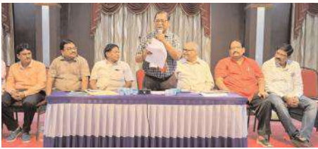
సమావేశంలో మాట్లాడుతున్న క్షత్రియ సంఘం ప్రతినిధులు