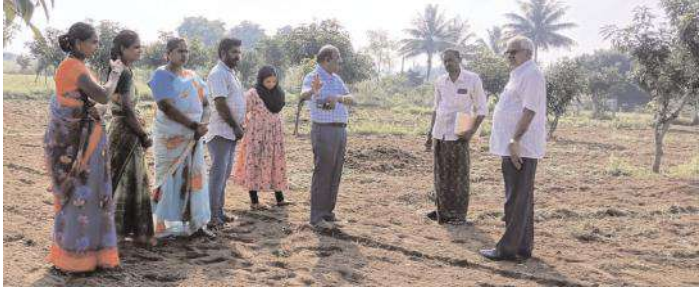
రాంపిచెర్ల, మేజర్ న్యూస్: