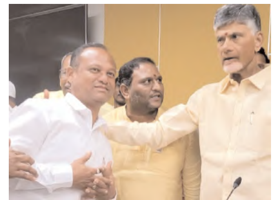
కుప్పం, మేజర్ స్కూల్స్:

తెలుగుదేశం పార్టీ అధినేత నారా చంద్రబాబునాయుడును విజయవాడలో బుధవారం దళిత నాయకులు కన్నన్ కలిసారు. అలాగే కుప్పం నియోజకవర్గంలోని పలువురు టీడీపీ నేతలు చంద్రబాబును కలిసారు.