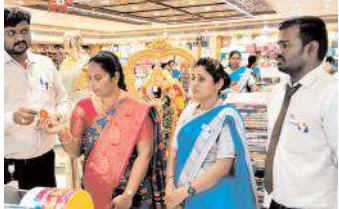
తిరుపతి కార్పొరేషన్ మేజర్ న్యూస్

తిరుపతిలోని ప్రముఖ షాపింగ్ మార్ట్ శుభమస్తు నిర్వహిస్తున్న పెద్ద పండుగలు పెద్ద పెద్ద కార్లు రోజుకో స్కూటర్ స్పీం లో భాగంగా 5వ రోజు లక్ష్మీ ద్రా విజేతగా విజయవాడ కు సౌందర్య గెలుపొందారు. ఈ మేరకు బుధవారం నిర్వహించిన లక్ష్మీ ద్రా ఎంపిక కార్యక్రమానికి ముఖ్య అతిథిగా