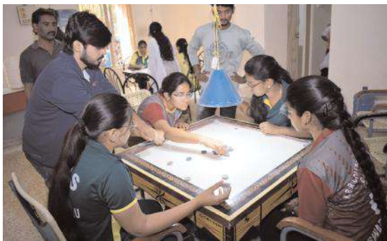
తిరుపతి కార్పొరేషన్, మేజర్ స్కూల్స్: