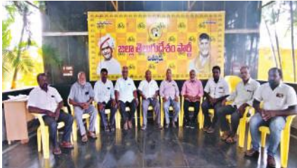
చిత్తూరు టిడిపి కార్యాలయంలో విలేకరుల సమావేశంలో మాట్లాడుతున్న నాయకులు

చిత్తూరు సిటీ, మేజర్ న్యూస్: ఈనెల 20వ తేదీన విజయనగరం జిల్లా పోలీస్ లైన్లో యువగలం పాదయాత్ర ముగింపు సభకి జిల్లా నుండి అశేషంగా ప్రజలు, తెలుగుదేశం పార్టీ కార్యకర్తలు తరలిరావాలని విజ్ఞప్తి చేశారు. తెలుగుదేశం పార్టీ యువనేత నారా లోకేష్ బాబు ఆధ్వర్యంలో యువగలం పాదయాత్ర దాదాపు 3132 కిలోమీటర్లు, 226 రోజులు జరిగిందని అన్నారు. 97 శాసనసభ నియోజకవర్గాల్లో 2100 గ్రామాలలో ప్రజలను పలకరిస్తూ! ప్రజలను కష్టాల్లో ఉన్న రైతులను ఓదారుస్తూ! ఆడబిడ్డలకు భరోసానిస్తూ! సాగిందని అన్నారు. ఈ పాదయాత్ర ప్రారంభంలో ఈ పాదయాత్ర వారం రోజుల్లో ఆగిపోతుందని, ఇన్ని రోజులు జరగదని, అవహేళన చేసినటువంటి