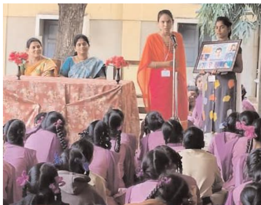
తిరుపతి కార్పొరేషన్ మేజర్ న్యూస్