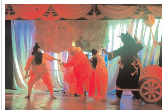
తిరుపతి కార్పొరేషన్, మేజర్ న్యూస్

ఎస్ఆర్ నాట్య కళాపరిషత్ 60వ వార్షిక కళోత్సవాల్లో భాగంగా మహాతి కళాక్షేత్రంలో నిర్వహిస్తున్న జాతీయ స్థాయి నాటక, నృత్య పోటీలలో రెండవ రోజైన మంగళవారం ప్రదర్శించిన సాంఘిక, పౌరాణిక పద్యనాటకాలు, నృత్యోత్సవాలు, ఆకట్టుకున్నాయి. ఇందులో భాగంగా ఉదయం నిర్వహించిన నృత్య పోటీలలో వివిధప్రాంతాలకు చెందిన కళాకారులు పాల్గొని తమదైన శైలిలో శాస్త్రీయ నృత్య ప్రదర్శనలతో తమ ప్రతిభా పాటవాలను చాటుకున్నారు. అనంతరం సాయంత్రం అసకాపల్లి సంఘమిత్ర ఆర్ట్ థియేటర్ వారు ప్రదర్శించిన దానానికి దారులెన్నో సాంఘిక నాటిక ప్రేక్షకులను ఆలరింపజేసింది. అనంతరం శ్రీసాయి సంతోషి నాట్య మండలి సురభివారు ప్రదర్శించిన శ్రీకృష్ణలీలలు పద్యనాటకం పౌరాణిక గొప్పతనాన్ని చాటింది. ఈ సందర్భంగా శ్రీకృష్ణుడు జననంతో మొదలై మేనమామ కంసుని సంహరించడంతో నాటకం పరిసమాప్తమైంది.