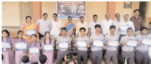
రొంపిచెర్ల, మేజర్ న్యూస్: