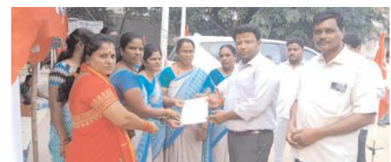
పుత్తూరు, మేజర్ న్యూస్:

అంగన్నాడి వర్షకు అగ్గదాన కార్యక్రమం చేపట్టిన సిబిటియూ నాయకులు