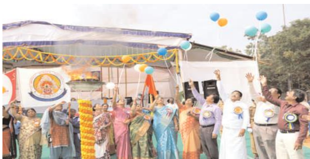
తిరుపతి కార్పొరేషన్ మేజర్ న్యూస్

శ్రీపద్మావతి మహిళా పాలిటెక్నిక్ కళాశాలలో రాష్ట్ర ప్రభుత్వ సాంకేతిక విద్యాశాఖ ఆధ్వర్యంలో రెండు రోజులపాటు జరిగిన రీజినల్ లెవెల్ ఇంటర్ పాలిటెక్నిక్ స్పోర్ట్స్, గేమ్స్ మీట్ బుధవారం ఘనంగా ముగిసింది. ఈ సందర్భంగా నిర్వహించిన పోటీలలో ఎస్పీడబ్ల్యు పాలిటెక్నిక్ విద్యార్థినులు