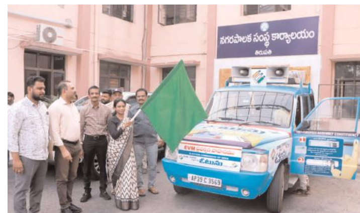
తిరుపతి కార్పొరేషన్, మేజర్ న్యూస్: