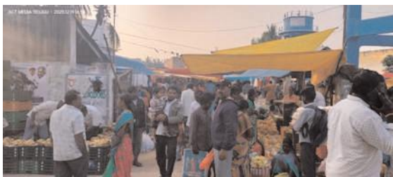
చౌడేపల్లి, మేజర్ న్యూస్:

మండలంలో మంగళవారం వారపు సంతనిర్వహిస్తారు. వారపు సంతలో దొంగతనం చేయడానికి అనుకూలంగా ఉంటుందని భావించిన దొంగలు ఇదే అడుగుగా తమ చేతివంటం ప్రదర్శిస్తున్నారు. దీనిపైన పోలీసులు ఎంతనిఘా పెట్టిననూ దొంగలు తమ నైపుణ్యం ప్రదర్శిస్తున్నారు. ప్రతి మంగళ వారము ఇద్దరు కానిస్టేబుళ్ళను సంతలో ద్యూటీ వేస్తున్నూ దొంగలు పోలీసుల కళ్ళుగప్పి చేతివంటం ప్రదర్శిస్తున్నారు. పోలీసులు మాత్రం ప్రజలను అప్రమత్తం చేస్తున్నారు.