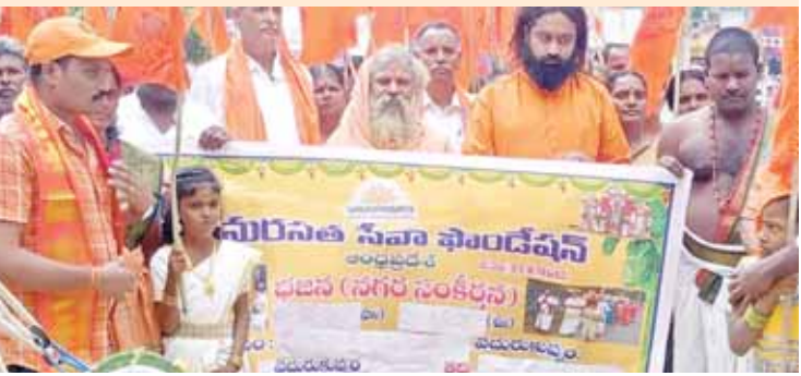
భజన కార్యక్రమాలతో ఊరేగుతున్న సమరసత సేవా ఫౌండేషన్ పీఠాధిపతులు