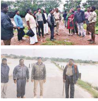
జిల్లాలో వివిధ నదీ ప్రవహిక ప్రాంతాల్లో పోలీసులు సహాయక చర్యలు

- తుఫాన్ నేపథ్యంలో పటిష్ట చర్యలు - రంగంలోకి పోలీస్ ప్రత్యేక బృందాలు, ఎస్ఐఆర్ఎస్ బలగాలు - జలపాతం, తీర్మాలు, డ్యామ్ ల వద్ద పోలీస్ పికెట్స్ - అధికారులతో సమన్వయం తప్పనిసరి: ఎస్పీ పరమేశ్వర్ రెడ్డి తిరుపతి క్రైమ్, మేజర్స్ న్యూస్: మిచెంగ్ తుఫాను కారణంగా బంగాళాఖాతంలో ఏర్పడిన అల్పపీడనం తీవ్ర రూపం దాల్చడంతో భారీ నుంచి అతి భారీ వర్షాలు పడుతాయని వాతావరణ శాఖ ఇచ్చిన నివేదిక ప్రకారం తిరుపతి జిల్లా పరిధిలోని అన్ని పోలీస్ స్టేషన్ల పరిధిలోని వాగులు, వంకలు, చెరువులు, జలపాతాల, డ్యాములు వద్ద సంబంధిత పోలీసు అధికారులు బందోబస్తు నిర్వహిస్తూ ప్రజలకు రక్షణగా నిలవాలని ఎస్పీ పరమేశ్వర్ రెడ్డి సూచించారు. తుఫాను ప్రభావంతో వర్షంతో పాటు ఈదురుగాలులు