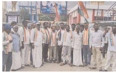
కుప్పంలో కాంగ్రెస్, వీసీకే పార్టీ నాయకుల సంబరాలు