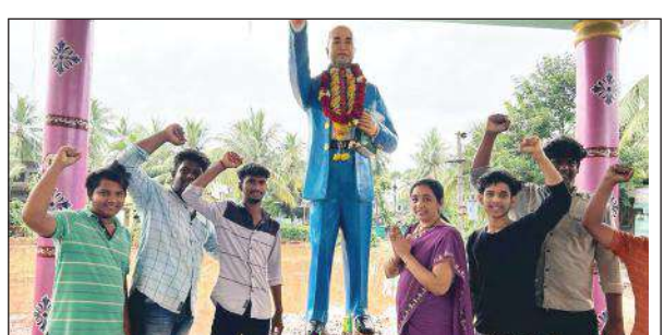
అంబేద్కర్- 1956 డిసెంబరు 6 వరమవదించారని ఆయన ప్రముఖ భారతీయ న్యాయవాది, ఆర్థిక శాస్త్రవేత్త, రాజకీయ నేత, సంఘ సంస్కర్త, ఇతను అంటరానితనం, కుల నిర్మూలన కోసం ఎంతో కృషి