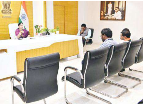
రాజమహేంద్రవరం, మేజర్ స్టూన్ : హేతుబద్ధీకరణతో కూడి, పారదర్శకంగా ఓటర్ల జాబితా రూపకల్పనలో రాజకీయ పార్టీల ప్రతినిధులు కీలక బాధ్యతలు నిర్వహించాల్సి ఉంటుందని జిల్లా కలెక్టర్ కె మాధవీలత పేర్కొన్నారు.

రాజమహేంద్రవరం, మేజర్ స్టూన్ : హేతుబద్ధీకరణతో కూడి, పారదర్శకంగా ఓటర్ల జాబితా రూపకల్పనలో రాజకీయ పార్టీల ప్రతినిధులు కీలక బాధ్యతలు నిర్వహించాల్సి ఉంటుందని జిల్లా కలెక్టర్ కె మాధవీలత పేర్కొన్నారు. స్థానిక కలెక్టర్ ఫాంబర్లో బుధవారం సాయంత్రం రాజకీయ పార్టీల ప్రతినిధులతో కలెక్టర్ జాయింట్ కలెక్టర్ డి.ఆర్.జి.ల సమావేశం నిర్వహించారు. ఈ సందర్భంగా కలెక్టర్ మాధవీలత మాట్లాడుతూ, డిసెంబరు రెండు మూడు తారీఖులలో నిర్వహించిన ఓటర్ల జాబితా పరిశీలన, ఓటు నమోదు, గుర్తింపు కోసం నిర్వహించిన ప్రత్యేక శిబిరాలలో 17924 దరఖాస్తులు రావడం జరిగింది అన్నారు. వాటిలో ఫారం 6 కి చెంది 11154, ఫారం 7 కి చెంది 1634, ఫారం 8 కి చెంది 5136 లు వచ్చినట్లు తెలిపారు. 18 19 సంవత్సరాల మధ్యలో ఉన్న యువతను కొత్త ఓటర్లుగా నమోదు చేయాలని, అందులో రాజకీయ పార్టీలు మరింత చురుకైన పాత్ర పోషించాలన్నారు. బాత్ లెవల్ స్థాయిలో రాజకీయ పార్టీలు బాత్ ఏజెంట్లను నియమించాలని తెలియజేశారు. 47 పోలింగ్ కేంద్రాల పరిధిలో పదికి మించి ఓటర్లు 66 చిరునామాలలో 787 మంది ఓటర్లు ఉన్నారని, వాటిని పరిశీలన చేస్తున్నట్లు తెలిపారు. డిసెంబర్ 20లో తేదీ జిల్లాకు చెందిన ఎన్నికల ప్రత్యేక పరిశీలకులు, సీనియర్ ఐ ఏ ఎస్ అధికారి ఎస్. యువరాజ్ జిల్లాకు రావడం జరుగుతోందని అన్నారు. పర్చులంలో భాగంగా రాజకీయ పార్టీ ప్రతినిధులు, అధికారులతో సమీకృత నిర్వహిస్తారని తెలియజేశారు. ఈ సమావేశంలో జాయింట్ కలెక్టర్ తేదీ భరత్, డి.ఆర్.జి. జీ సరసింహలు, రాజకీయ పార్టీల ప్రతినిధులు బిజెపి బి రామచంద్ర రావు, వైఎస్ఆర్ పి కె కాశీశర్మ, టీడీపీ పి ఎస్ నిబ్రహ్మణ్యంలు పాల్గొన్నారు.