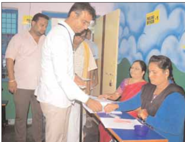
కుత్బుల్లాపూర్ మేజర్ న్యూస్: ప్రతి ఒక్కరు ఓటింగ్ లో పాల్గొని తమ