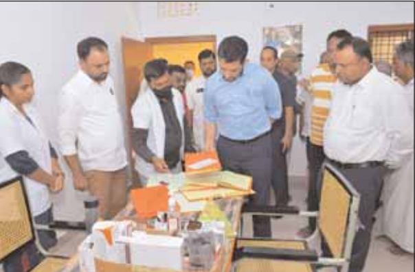
★సకాలంలో పన్నులు చెల్లించి మున్సిపాలిటీల అభివృద్ధికి సహకరించాలి మున్సిపాలిటీల అభివృద్ధికి ప్రతి ఒక్కరూ తోడ్పాటునందించాలి.