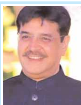
అన్నాద్ బలాల మలక్ పేట్ అధిక్యం : 26106