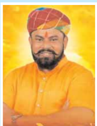
డి. రాజానిగండ్ గోపామహల్ అధిక్యం : 21457