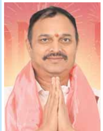
బంధారి లక్ష్మారెడ్డి ఉప్పల్ అధిక్యం : 49030