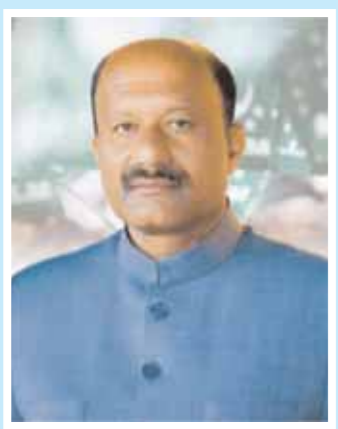
ఎండి మొయిన్ బంధారిపూర్ అధిక్యం : 67025