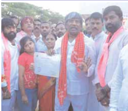
సీతాఫలమండి, మేజర్ న్యూస్: సికింద్రాబాద్ నియోజకవర్గంలో నిరంతరం తాను ప్రజలకు అందుబాటులో నిలిచి తన వంతు సేవలు అందించానని, సీతాఫలమండిలో కార్యాలయాన్ని ఏర్పాటు చేసుకొని ప్రజా సమస్యలను