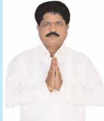
మాహేశ్వరం కృష్ణారావు కుకడవల్లి అధిక్యం : 70387