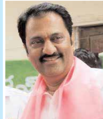
మాగండి గోపినాథ్ జాడ్ హాట్స్ అధిక్యం : 13551