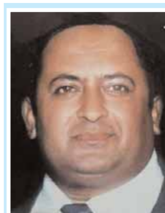
మీర్ జయీకర్ అబీ చార్మినార్ అధిక్యం : 22853