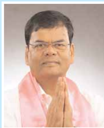
చాిత్యం వెంకటేశ్ ఆంబర్ నిబి అధిక్యం : 24537