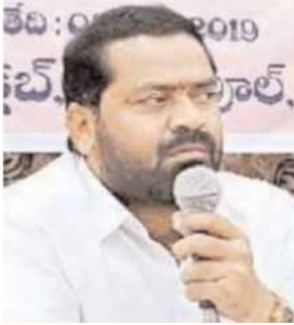
పాలుఅయ్యారని,కలెక్టర్ల వ్యవస్థను గుప్పెట్లో పెట్టుకుని ఇష్టారాజ్యంగా పాలనను కొనసాగించారన,ఇ అనేక అక్రమాలకు పాల్పడిన పాలనను ప్రజలు గుర్తించి,నేడు కాంగ్రెస్ పార్టీకి వట్టంకట్టి