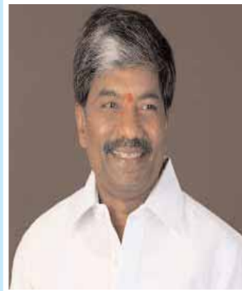
పద్దారావు సికంద్రావార్ అధిక్యం : 45240