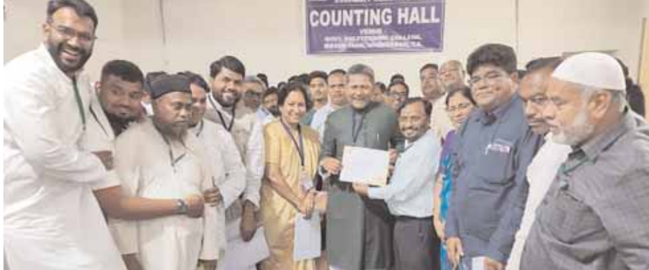
సిటీబ్యూరో,మేజర్ న్యూస్: కార్యాచార్యుల ఎమ్మెల్యేగా మూడోసారి ఎన్నికైన ఎమ్మెల్యే కౌసర్ మోహియుద్దీన్ హ్యూటీక్ రికార్డును సాధించారు. ఆదివారం మాన్ టెక్నాలజీలోని ప్రభుత్వ పాలిటెక్నిక్ కళాశాల ప్రాంగణంలో ఏర్పాటు చేసిన

కార్యాచార్యుల నియోజకవర్గం డి.ఆర్.సి. కేంద్రంలో జరిగిన ఎన్నికల కౌంటింగ్ కేంద్రంలో ప్రత్యేకంగా కార్యాచార్యుల నియోజకవర్గం ఎన్నికల లిటల్ టాకర్ అధికారి కొమురయ్య, ఓట్ల లెక్కింపు పూర్తి అయిన తర్వాత కార్యాచార్యుల విజేతగా మజ్లీస్ పార్టీ అభ్యర్థి కౌసర్ మోహియుద్దీన్ కు ఎన్నిక గెలుపు ధృవీకరణ పత్రాన్ని ప్రత్యేకంగా అందజేశారు. అనంతరం కార్యాచార్యుల ఎమ్మెల్యే కౌసర్ మోహియుద్దీన్ మాట్లాడుతూ తనను మూడోసారికూడ కార్యాచార్యుల ఎమ్మెల్యేగా గెలిపించినందుకు తాను కార్యాచార్యుల నియోజకవర్గం ప్రజలకు ఎంతో రుణపడి ఉన్నానని ఆయన చెప్పారు. తన గెలుపుకు అన్ని విధాలుగా ఎంతో కృషి చేసిన వారందరికీ ప్రత్యేకంగా ధన్యవాదాలు తెలియజేస్తున్నట్లు ఎమ్మెల్యే కౌసర్ మోహియుద్దీన్ తెలిపారు.