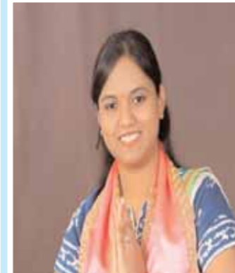
రాజు నందిక కండోస్రెంట్ అధిక్యం : 17169