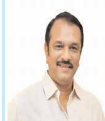
దేవిరెడ్డి సుధీరరెడ్డి ఎల్ బీ నగర్ అధిక్యం : 18918