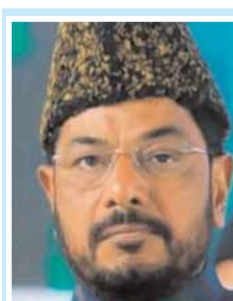
జయరం మంసూర్ యాకుబ్ నగర్ అధిక్యం : 878